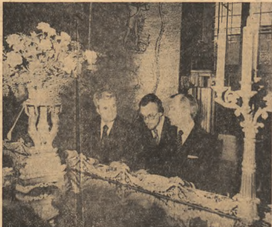
La dejunul oferit de președintele Consiliului municipalității Stockholm