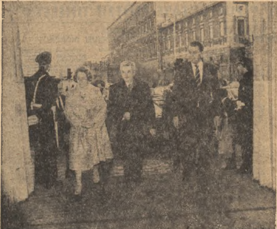
Sosirea la președinția Consiliului de Miniștri