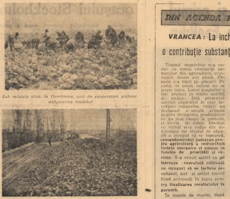
Sub rafalele ploii, la Dumbrava, zeci de cooperatori grăbesc adăpostirea roadelor