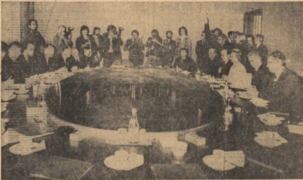
In timpul convorbirilor oficiale

Începerea convorbirilor oficiale dintre președintele Nicolae Ceaușescu și primul ministru al Suediei, Thorbjørn Faellin