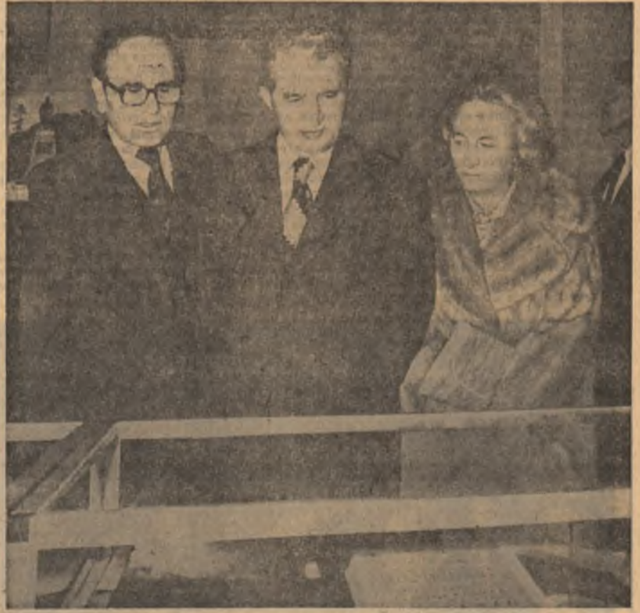
La Universitatea din Uppsala

Rugăți să precizați care este domeniul cel mai important în care consideră că se poate realiza o largă cooperare cu Suedia, președintele NICOLAE CEAUȘESCU a răspuns: