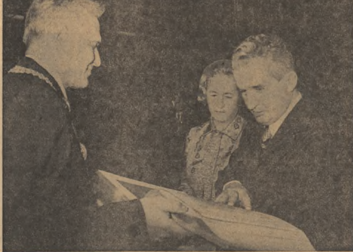
În vizită la Universitatea din Uppsala

ceastă puternică cetate industrială a țării, ca și cele dobîndite de întregul nostru popor. Vă încredințăm, tovarășe secretar general, că, urmînd înalțul dumneavoastră exemplu de abnegație, dăruire și devotament neîmărmit față de patrie, oamenii muncii din județul Brașov, în frunte cu comunistii, alături de întregul nostru popor, vor acționa cu și mai multă înăfățișe și avînt creator pentru înfăptuirea politicii interne și externe a partidului și statului, a sarcinilor ce le revin din hotărîrile istorice ale Congresului al XII-lea, sporindu-și, astfel, contribuția la înflorirea multilaterală a României socialiste.