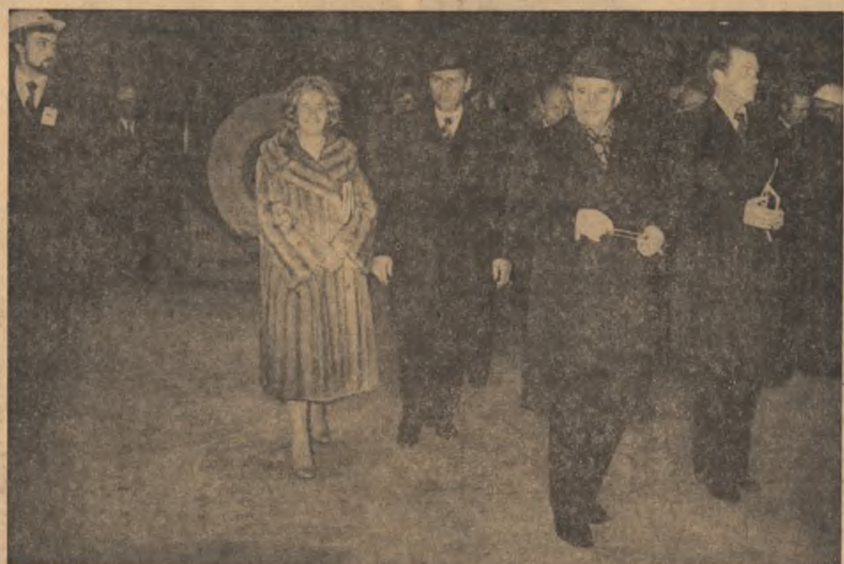
Vizita la moderna uzină de oțeluri inoxidabile „Avesta”