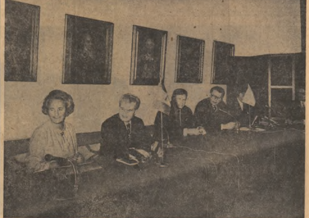
În timpul conferinței de presă de la Palatul Ministerului Afacerilor Externe.