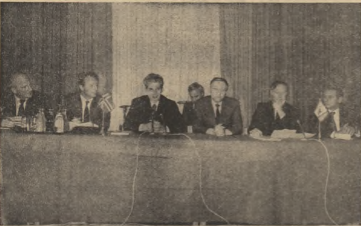
Intalnirea cu reprezentanti ai cercurilor industriale si economice norvegiene

Dineu oficial oferit in onoarea tovarasului Nicolae Ceausescu si a tovarasei Elena Ceausescu