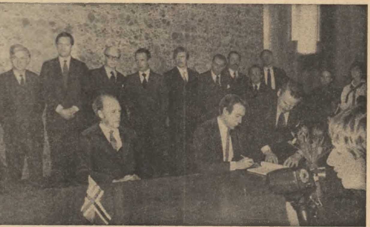
În timpul ceremoniei semnării documentelor oficiale româno-norvegiene