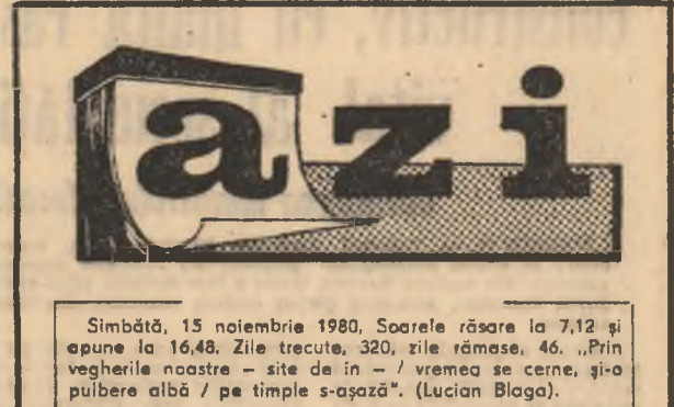
Simbătă, 15 noiembrie 1980. Soarele răsare la 7,12 și apune la 16,48. Zile trecute, 320, zile rămase, 46. „Prin vegherile noastre - site de în - / vremea se cerne, și o pubele albă - pe timp se-aspază”. (Lucian Blaga).