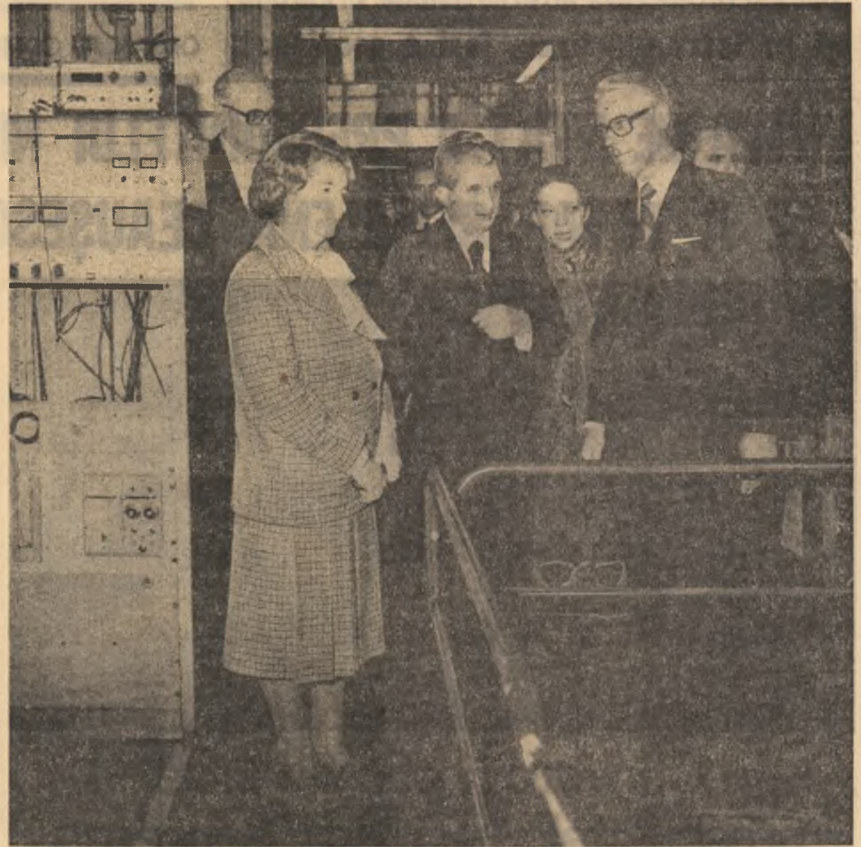
În vizită la firma „Det Norske Veritas”

Președintele Nicolae Ceaușescu a invitat pe Majestatea Sa regele Olav al V-lea, precum și pe primul ministru Odvar Nordli să efectueze vizite oficiale în România. Invitațiile au fost acceptate cu plăcere. Datele vizitelor urmează să fie stabilite pe căi diplomatice.