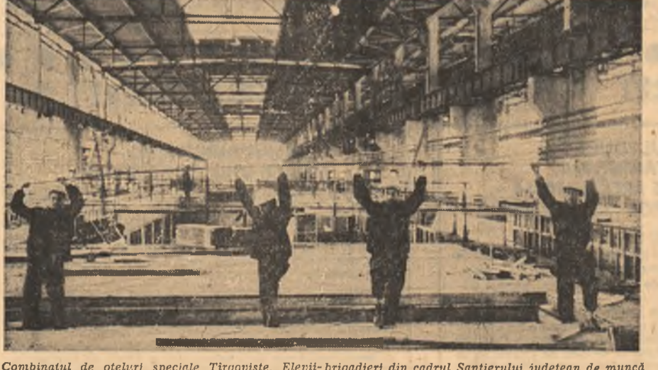
Combinatul de oțeluri speciale Tirgoviște. Elevii-brigadieri din cadrul Șantierului județean de muncă patriotică lucrînd la darea în folosință a unor noi capacități de producție