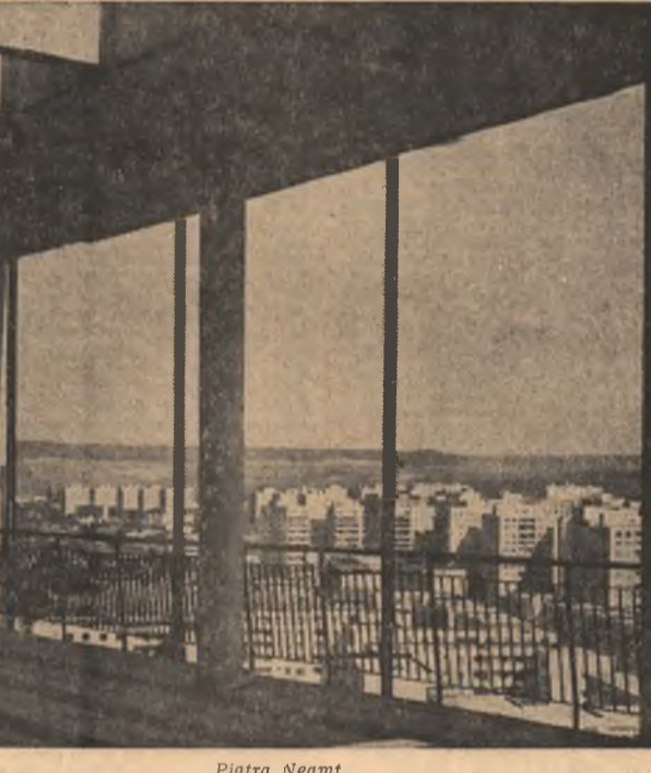
Piatra Neamț