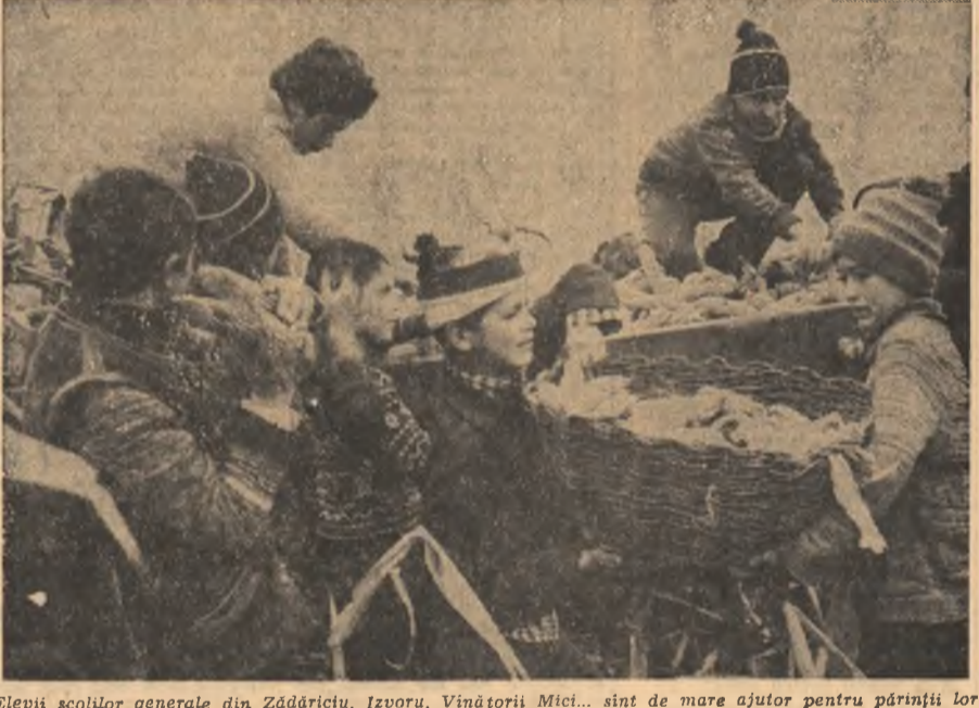
Elevii școlilor generale din Zădăriciu, Izvoaru, Vinătorii Mici... sînt de mare ajutor pentru părinții lor la adăpostirea ultimelor cantități de recoltă

în cel care marchează hotarul cu vecinii din Dimbovița și Teleorman, se acționa intens, cu numărul mare de forțe pe tîrînduri în unitățile constituite unic agroindustriale Vinătorii Mici. Aici, locul cîmpiei este luat treptat de terenuri văluite, cu soluri grele. Înși localnicii „din