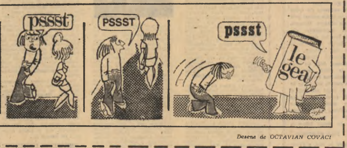
Desena de OCTAVIAN COVACI