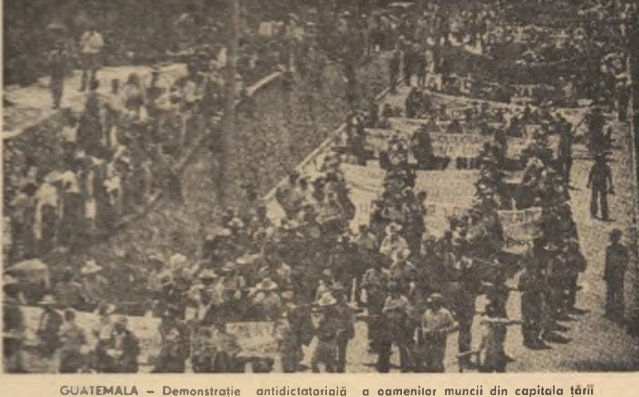
GUATEMALA — Demonstrație antidictatorială a oamenilor muncii din capitala țării