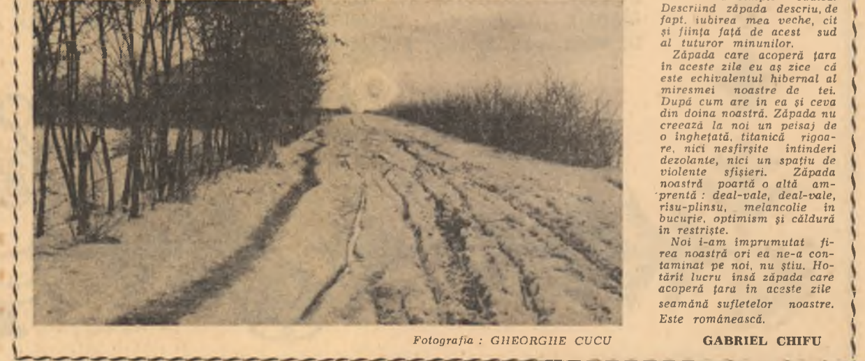
Fotografia: GHEORGHE CUCU GABRIEL CHIFU

In memoria mea fiecare zăpadă care cade nu cade singură, ci cade însoțită de toate ninsorile pe care le-am trăit pînă la ea. Mi se pare că zăpada acestor zile nu numai la figurat, dar și la propriu conține toate zăpezile vieții mele: zăpada acestor zile e dublă, e triplă, e multiplă, ninge imens, ninge fantastic, ninge prodigios — glorie a zăpezii. De la o vreme troienele nu se mai întineau decît în învocațiile poezilor. Iar acum, uite, delicat și ferzătorul pantof bucureștean nu știe