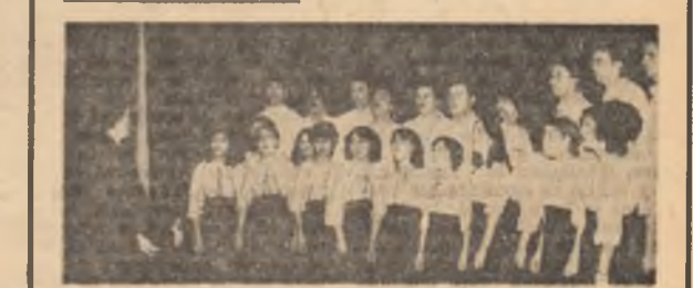
Corul Facultății de construcții căi ferate, drumuri și poduri — București...