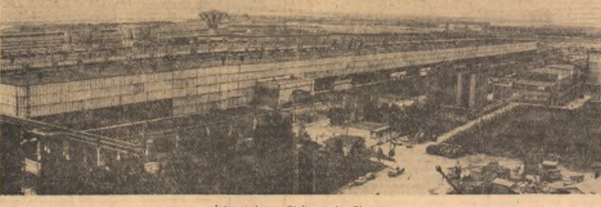
Întreprinderea „Oțelinox” din Tîrgoviște

EMIL STANCIU (Continuare în pag. a II-a)