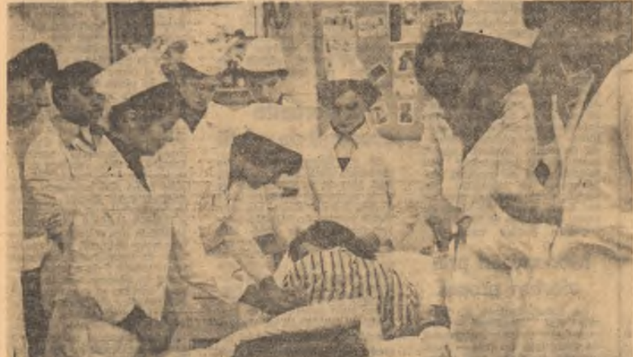
Oră aplicativă la Liceul sântar din Bacău.