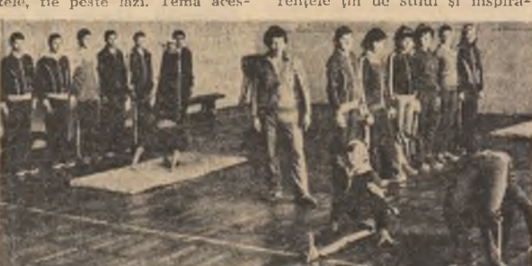
destinate tocmai asigurării unui cadru optim de pregătire și perfecționare. Drept, continuă să existe unele lacune în ceea ce privește, mai ales, materialele sportive...