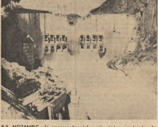
R.P. MOZAMBIIC: În imagine barajul marii hidrocentrale de la Cabora Bassa de pe fluviul Zambezi