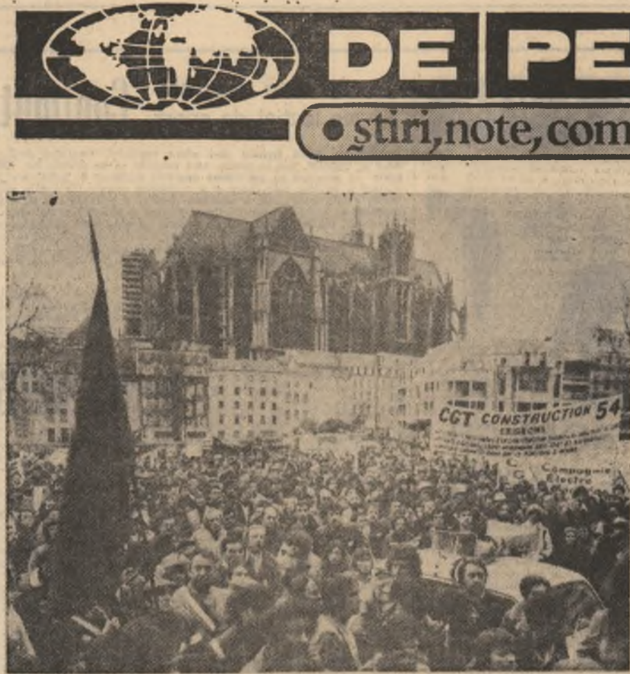
FRANȚA: Demonstrația oamenilor muncii din orașul Lyon pentru îmbunătățirea condițiilor de muncă și viață

prezentanții americani și cei ai Pieței comune, impasul a fost totuși și nici nu s-a prevăzut o nouă întâlnire consacrată negocierilor acestor chestiuni, scrie U.P.I. Totodată, sursa citată menționează că un element care a creat dificultăți a fost cererea prezentată de delegația niponă ca situația Japoniei să fie considerată un caz deosebit și tratat ca atare. Eșecul acestor negocieri dovedește încă o dată că, în actuala perioadă, când recesiunea economică afectează economiile țărilor occidentale, concurența devine mai aprigă, ceea ce duce la amplificarea dificultăților și a divergențelor de natură economică.