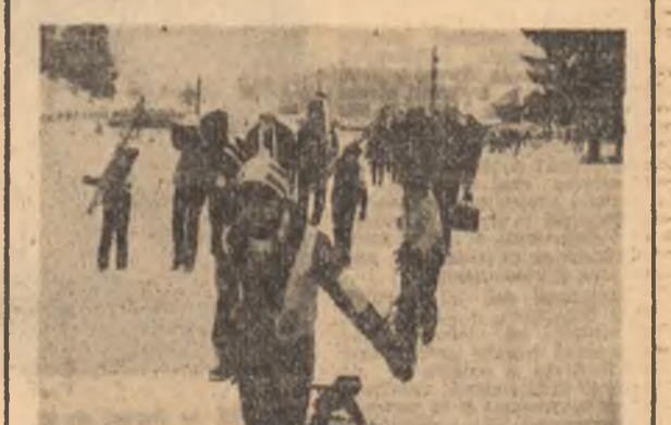
Elevii și studenții — statornici iubitori ai sporturilor de iarnă