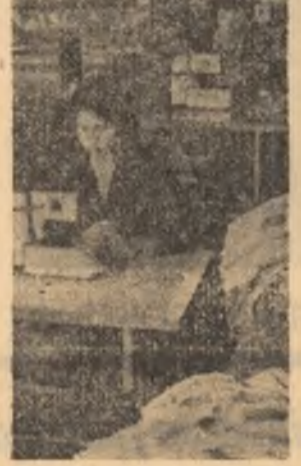
Aspect din secția criticilor helene din cadrul Centrului de producție industrială al C.A.P. Patcoava, Județul Ol.