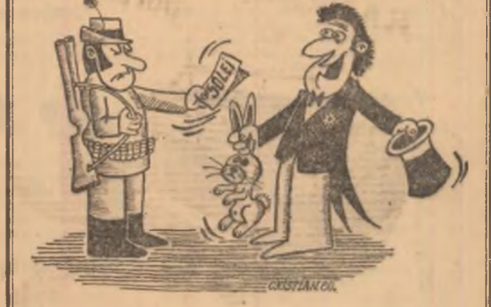
Desen de CRISTIAN MIHAILESCU