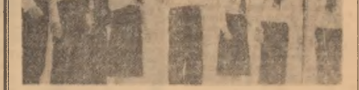
In ultima parte a lunii decembrie, Casa de cultură a tineretului din Tulcea a fost gazda primului Festival județean al brigazilor artistice și al grupurilor satirice. Din cele aproape 50 de formații participante, cea mai bună a fost decretată de juriu brigada artistică a Casei de cultură a orașului Salina.