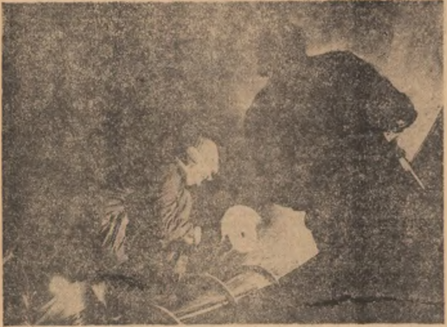
Constructorii de utilaj chimic bucureșteni pregătesc o premieră a anului 1981 - prototipul fermentatorului pentru industria chimică