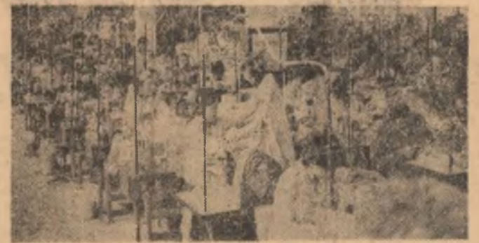
Activitate febrilă într-o nouă secție a Întreprinderii de confecții din Saveni

Astfel, constructorii grupului de șantier oțelării-refractare au montat importante cantități de utilaje tehnologice la subobiectivele de la O.L.D. 3, punând deja în operă peste 100 tone de utilaje și instalații. De asemenea, constructorii de la Întreprinderea de construcții montaj Siderurgice Galați au montat în aceste zile în instalația de prindere a podului rulant de 200 tone/forță, au pus pe terasamente circa