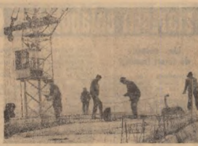
Construcții bucureștene în lupta cu înălțimile

La întreprinderea „SARO” din Tiroviste au fost introduse în producția curentă noi produse. Printre acestea se remarcă primul strunc „SNA-1000” de preiecat buriane pentru foraj, care permite adaptarea celor mai moderne dispozitive și scule de aschiere, dovedit în pe- rtoia de omologării caracteris- ticilor tehnico-funcționale su- perioare tipurilor similare existente pe piața externă. Tot pe linia inovării produc- ției se înscrie astmilara strungului paralel cu co- mandă numerică „SN-1 250” destinat executării unor re- pere și piese de mare pre- cizie și forme geometrice deosebit de complicate, care pînă acum erau procurate din import. Este de subliniat faptul că aproape trei ster- turi din producția unității dimbovitene o reprezintă produsele noi sau modernizate, și că, mai bine de ju- mătate din strungurile pur- tind marca „SARO” sint desinate exportului, ele fiind solicitate de firme din peste 20 de țări ale lumii.