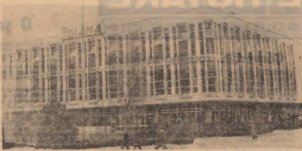
Magazinul „Diana”, unul din cele mai solicitate din orașul Tulcea.

Președintele Comitetului Militar de Redresare pentru Progres Național, Șeful Statutului Republicii Voila Superioară