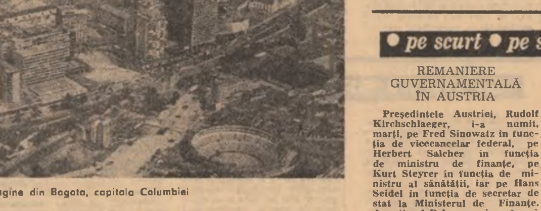
Imagine din Bogota, capitala Columbiei