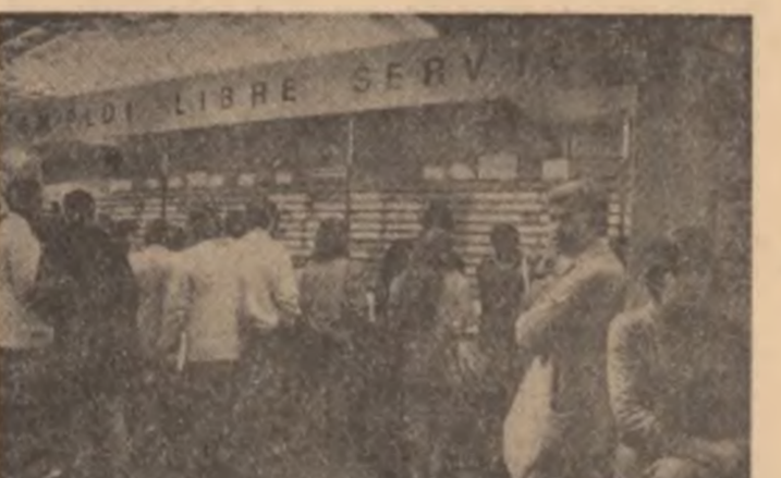
În anul 1980, șomajul a sporit în Franța cu 11 la sută. Potrivit cifrelor oficiale, în prezent, armata celor fără lucru din această țară are un efectiv de 1 630 000. În fotografie, aspect de la Oficiul central de plasare din Paris

SOFIA 30 (Agerpres). — La Sofia a fost dat publicității comunicatul statistic privind îndeplinirea planului economiei naționale bulgare anul 1980. În comunicat se arată că, față de anul precedent, în 1980 venitul național a crescut cu 5,7 la sută, aproape în creștere spor realizându-se prin creșterea productivității sociale a muncii. Ministeriile și departamentele și-au îndeplinit planul anual la producția netă cu 101,1 la sută. S-au obținut beneficii peste plan în valoare de 440 milioane leva. Volumul producției industriale a fost de 25.978 milioane leva