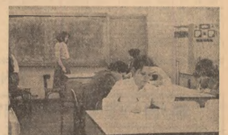
SESIUNE 1981: Inspirație de moment, dar mai ales munca unui întreg semestru!