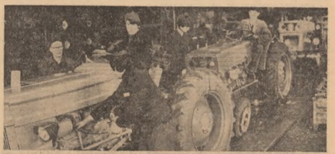
Organizațiile U.T.C. în munca lor de zi cu zi EXPERIENȚE • REALIZĂRI • INIȚIATIVE

Convorbirea s-a desfășurat într-o atmosferă tovarășească, de caldă prietenie și stimă reciprocă.