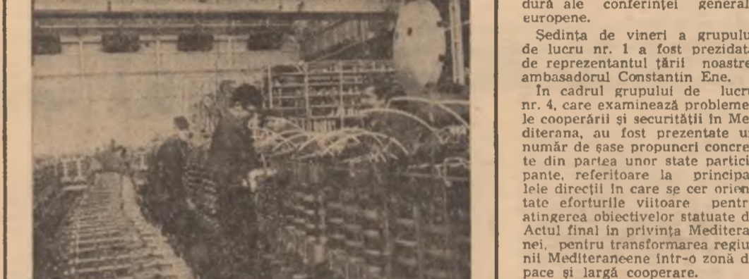
Imagine din fabrica de transformatoare electrice din Jankomir, unitate care face parte din marele complex industrial „Rade Koncar” din apropiere de Zagreb

Oamenii muncii din Iugoslavia veșnic și prietenă au început anul sub semnul hotărârii de a acționa ferm pentru creșterea productivității, a eficienței economice și a calității produselor. În contextul acestor preocupări, numeroase unități industriale promovează un amplu proces de dezvoltare și modernizare, de a pune la dispoziție a unor mașini și utilaje cu parametri superiori. Prezentăm, în cele ce urmează, câteva secvențe ilustrative din activitatea unor unități industriale iugoslave.