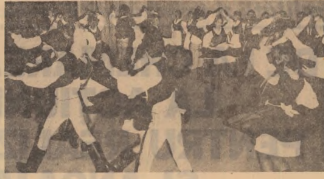
În iureșul dansului