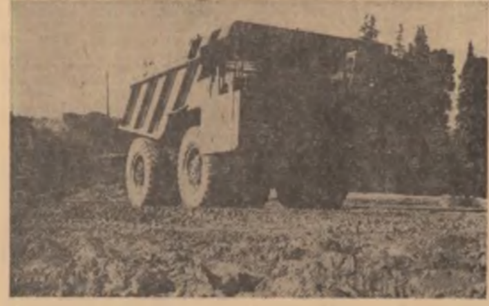
„Fabricat la I.M. Mirșea” — un titlu de mândrie pentru tinărul colectiv care livrează economiei naționale autobasculante grele, la nivelul celor mai bune din lume

În domeniul construcțiilor de mașini, angajamentul prevede, între altele, scđrtarea cu minimum 3 luni a termenelor de punere în fabricație a unui număr de 10 produse prevăzute în plan, modernizarea suplimentară a 30 produse, introducerea și extinderea în producție a 15 tehnologii noi și perfecționare