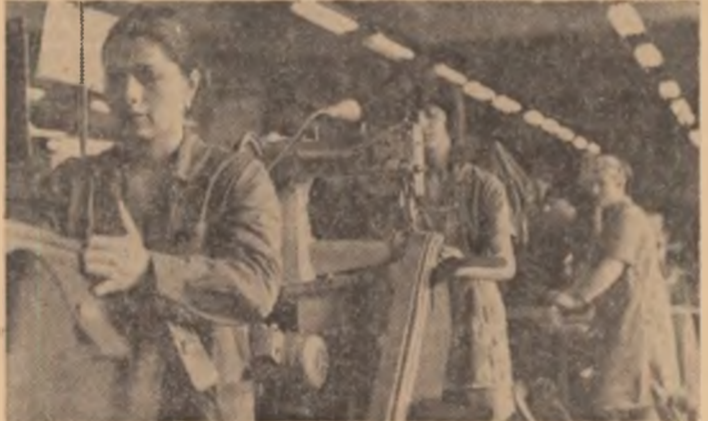
Calitatea produselor fabricate la întreprinderea „13 Decembrie” se hotărâște la fiecare loc de muncă și de către fiecare muncitor

Sala de protocol a întreprinderii „13 Decembrie” din Sibiu care adăpostește și o expoziție permanentă cu produse realizate aici a fost deosebit de animată în acest început de an. Numeroși oameni de afaceri din diverse țări ale lumii s-au perindat prin ea pentru a vedea ce pot cumpăra și pentru a încheia contracte. L-am auzit pe unul dintre acești beneficiari ai întreprinderii, venit tocmai din Statele Unite ale Americii, exprimîndu-și firească surpriză pentru frumusețea, calitatea și funcționalitatea produselor prezentate: valize, genti, poșete, borsete, valize diplomat, mape, serviete etc. „Puteți să vă socotiți printre cei mai buni din lume, dacă nu cei mai buni, mai ales în ceea ce privește articolele de voiaj”, spunea exigentul cumpărător. Nu întimplător, așadar, că mai mare parte a contractelor la export pentru 1981 sînt încheiate cu firme importatoare din S.U.A., Canada, R.F.G., Anglia, Belgia și altele, ceea ce reprezintă o frumoașă și laudabilă performanță. Pentru că, într-adevăr, 70 la sută din totalul