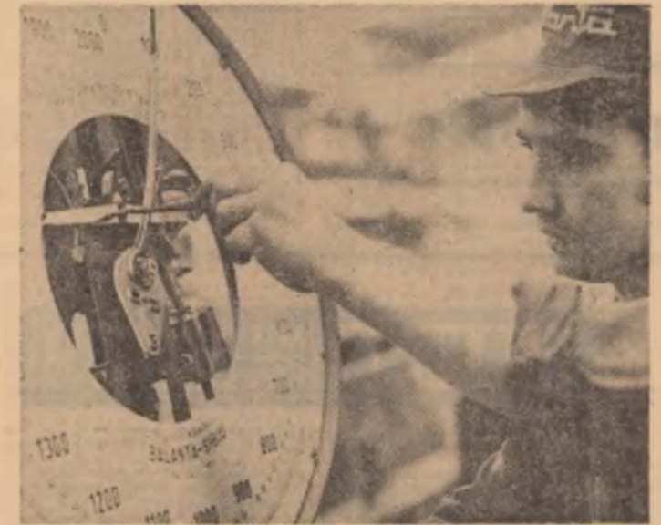
Aici la „Balanța”, calitatea produselor se măsoară cu cel mai exact etalon: conștiința și răspunderea muncitorească pentru lucrul bine făcut