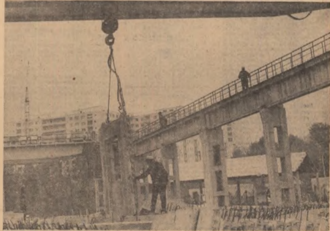
Tipzarca construcțiilor într-un procent de aproape 100 la sud asigură pe șantierele de locuințe un ritm înalt de execuție inclusiv pe timp de iarnă

Prin soluții tehnologice și metode de muncă de mare productivitate, angajamentul prevede darea în folosință cu 15 zile înainte de termen a 1.200 de aparatamente, din cele 3.500 planificate în acest an