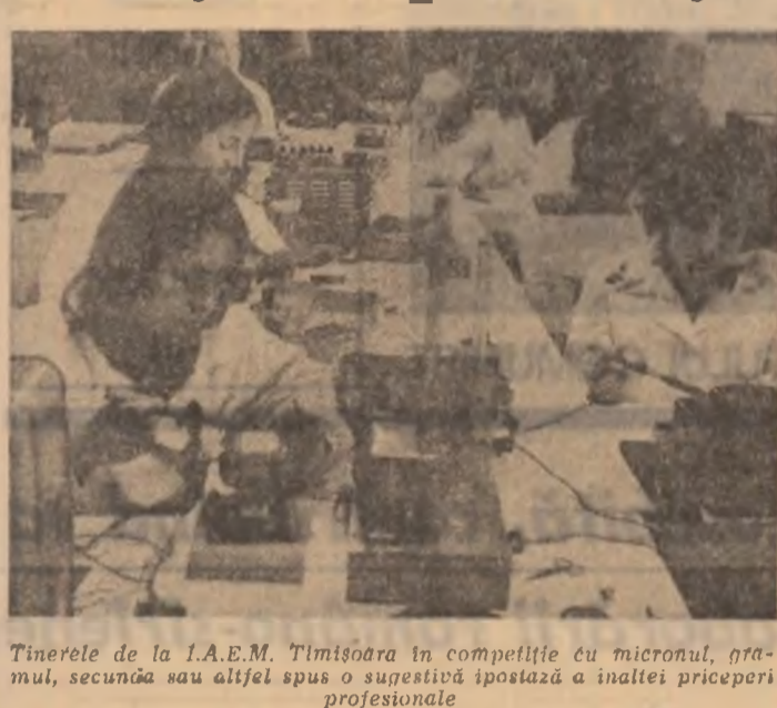
Tineretele de la I.A.E.M. Timisoara în competiție cu micronul, nramul, secunța sau altfel spus o sugestivă ipostază a înaltei priceperi profesionale