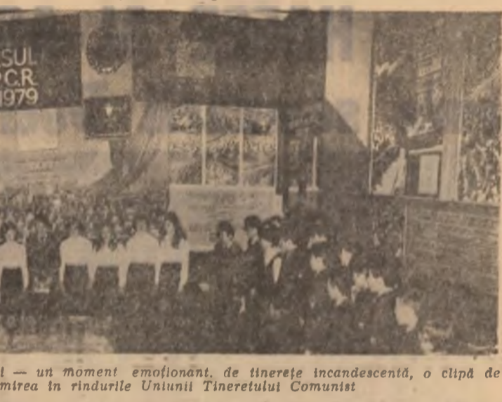
La muzeul de istorie a partidului — un moment emoționant de tinerete încandescentă, o clipă de neuitat — primirea în rândurile Uniunii Tineretului Comunist