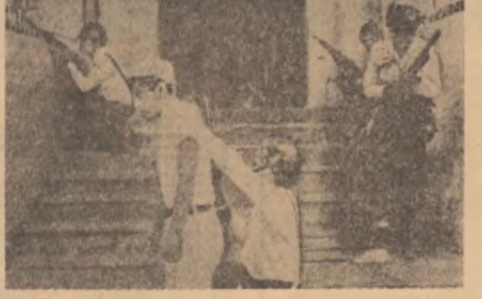
SALVADOR — Pe străzile capitalei țării, San Salvador, continuă luptele

țării se află într-un stadiu avansat de construcție o fabrică de sifetare a diamantelor. Diamanții reprezintă una dintr-nclele bogății ale Botswanei, producția anuală fiind de aproximativ 4,5 milioane carate. Se prevede că în 1985 producția să ajungă la zece milioane carate, prin darea în exploatare a minei de la Diwane.