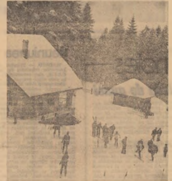
Sus pe pîrțile Postăvarului

In zilele de 20, 21 și 22 februarie, în orașul belgian Arlon se vor disputa meciurile turneului final al „CUPEI CUPELOR“ la volei masculin, la care oște calificată și formată STEAUA BUCUREȘTI, alături de echipele TSKA Sofia, Avtomobilist Leningrad și Steaua Rostov-Bratîskava.