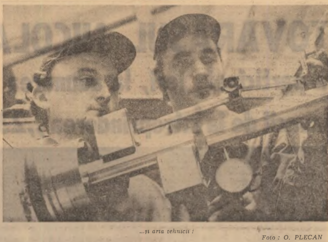
...și arta tehnică!