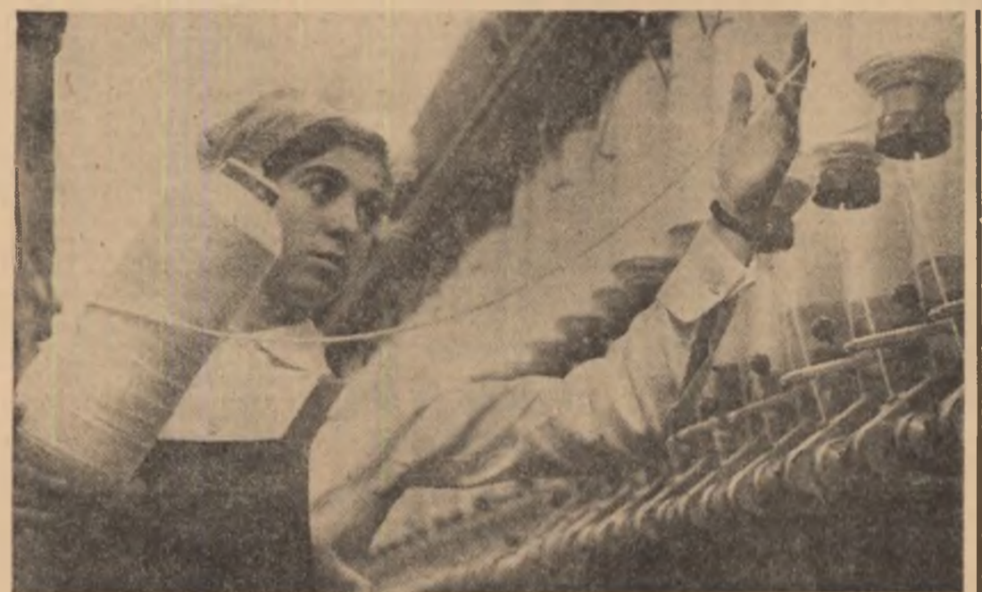
O privire a competenței tinere spre cea mai înaltă calitate a muncii

ORGAN AL COMITETULUI CENTRAL AL UNIUNII TINERETULUI COMUNIST