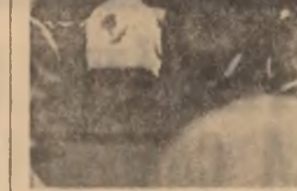
Eleon Școlii nr. 16 din București într-un frumos spectacol pe scena cinematografului Gloria.

Pentru că, să nu uităm, organizația U.T.C. au datorita să se ocupe de toate problemele de muncă și de viață, deopotrivă ale tinerilor, și ai ale celor care nu sînt membri ai organizației.