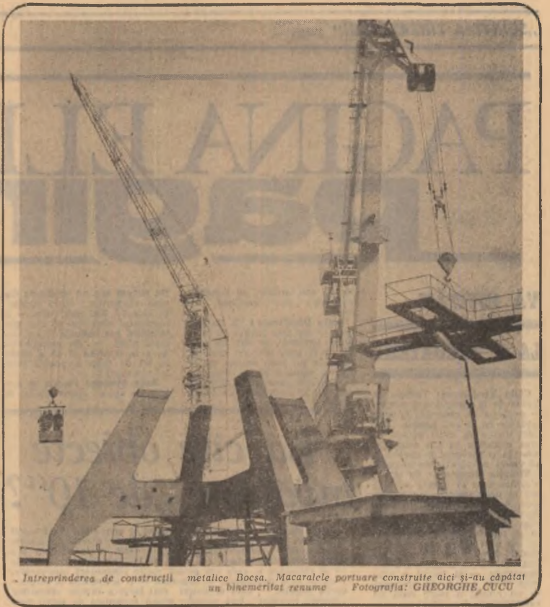
Întreprinderea de construcții metalice Bocea. Macaralele portuare construite aici și-au căpătîit un binemerit renume.