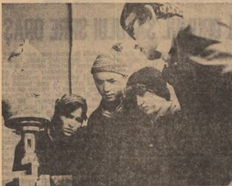
Oră de atelier la Liceul industrial nr. 1 din Reșița.