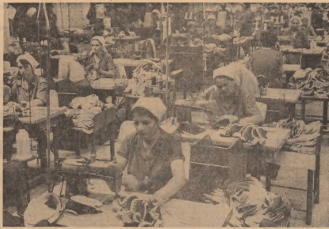
O firmă ale cărei produse sint apreciate în întreaga țară: Întreprinderea de talpă și încălțăminte din cauciuc — Dragășani