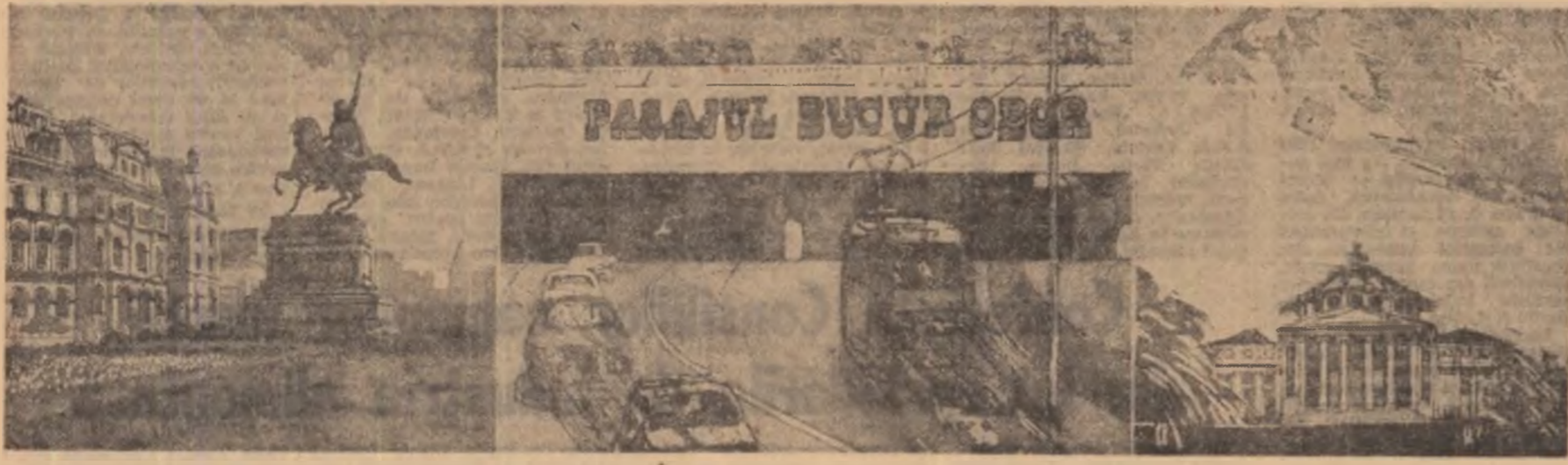
Pagină ilustrată cu gravuri de Rodica Oancea, Ioana Bătrînu, Elena Drăgulelei, Eva Mentzeloupoulou, Tania Siperco, studente — anul II grafică, Institutul de Arte Plastice „Nicolae Grigorescu“ din București