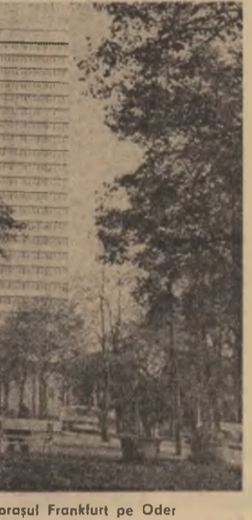
R.D.G. — Imagine din orașul Frankfurt pe Oder

PREȘEDINTELE RONALD REAGAN l-a primit, la Casa Albă, pe ministrul afacerilor externe al Israelului, Yitzhak Shamir, care efectuează o vizită oficială în S.U.A. După cum s-a precizat, în cadrul convorbirii au fost examinate evoluția raporturilor dintre S.U.A. și Israel, precum și unele probleme internaționale.