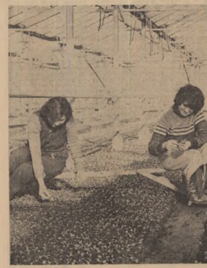
Ferma sere-solarii Costești — Argeș. Se execută repicalul răsadurilor.

În cadrul programului de dezvoltare a liniei de combinat petrochimic-Telexen a început să producă, zilele acestea, o modernă instalație, capabilă să asigure anual o cantitate de 10 000 tone normal — parafină, materie primă folosită la fabricarea pe cale industrială a detergenților biodegradabili. Instalația, prima de acest fel din țară, al cărei proiect aparține specialiștilor IITPIC-București, a fost realizată în totalitate cu utilaje și aparatură românești. Ea contribuie la valorificarea superioară a „aurului negru”, folosind ca materie primă în fluxul tehnologic continuu unele fracții rezultate din procesul de prelucrare. Cu elan se acțiunează acum pentru finalizarea altor investiții din plan pe anul în curs între care se remarcă instalația pentru obținerea de aditivi, la care, de altfel, au început probele tehnologice.