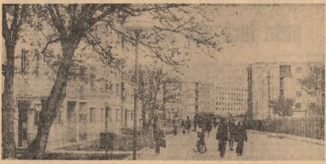
Muguri de tinerețe, muguri de primăvară

● În unitățile economice ale municipiului Oradea, prin acțiunile de muncă patriotică în scrijina produselor, 3.000 de tineri au realizat suplimentar 1,5 tone alumina calcinată, 200 de perechi de încălțăminte, 300 m țesături, 50 de seturi accesorii milioane de transport.