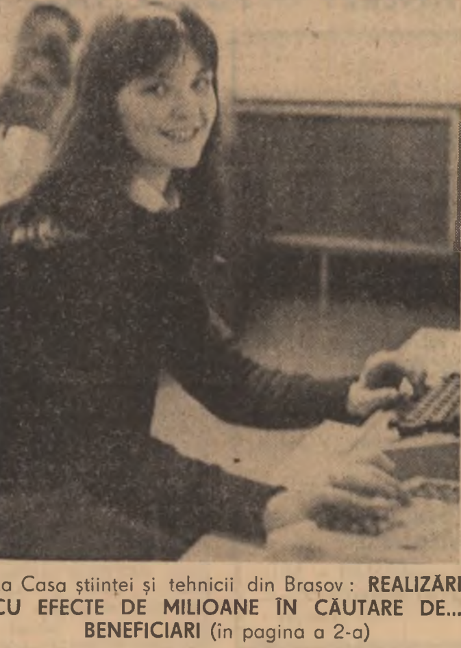
La Casa științei și tehnicii din Brașov: REALIZĂRI CU EFECTE DE MILIOANE ÎN CĂUTARE DE... BENEFICIARI (in pagina a 2-a)

„PUTEREA ÎNTUNERICULUI” ȘI SLUJITORII SAI Diagnosticul medical este fără echivoc — bolnava prezintă o stare de deminție gravă, ireversibilă, o stare de marasm cronic-ritrional, prin deficiți proteic cronici. Or, se știe, că proteinele constituie structura de bază a materiei vii, din ele formîndu-se