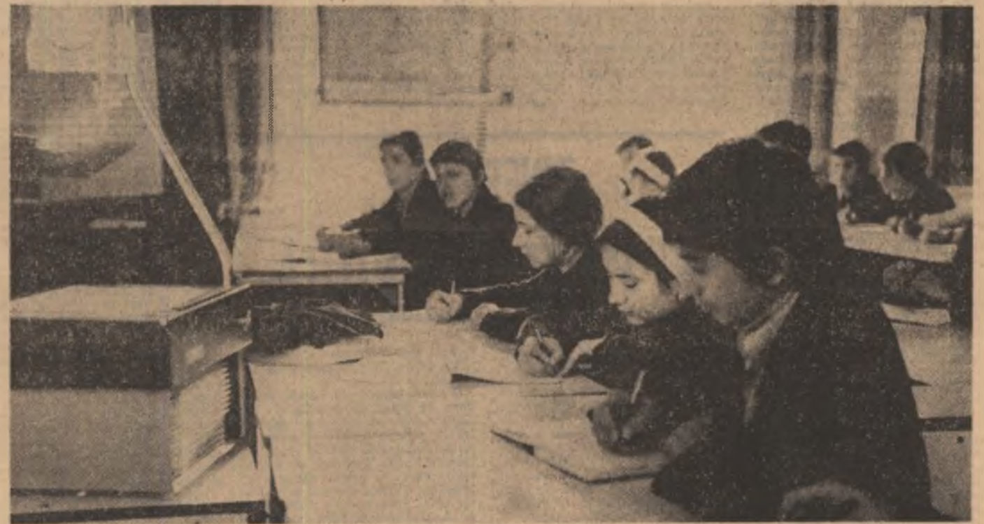
Oră de curs la Liceul industrial nr. 1 din Reșița.