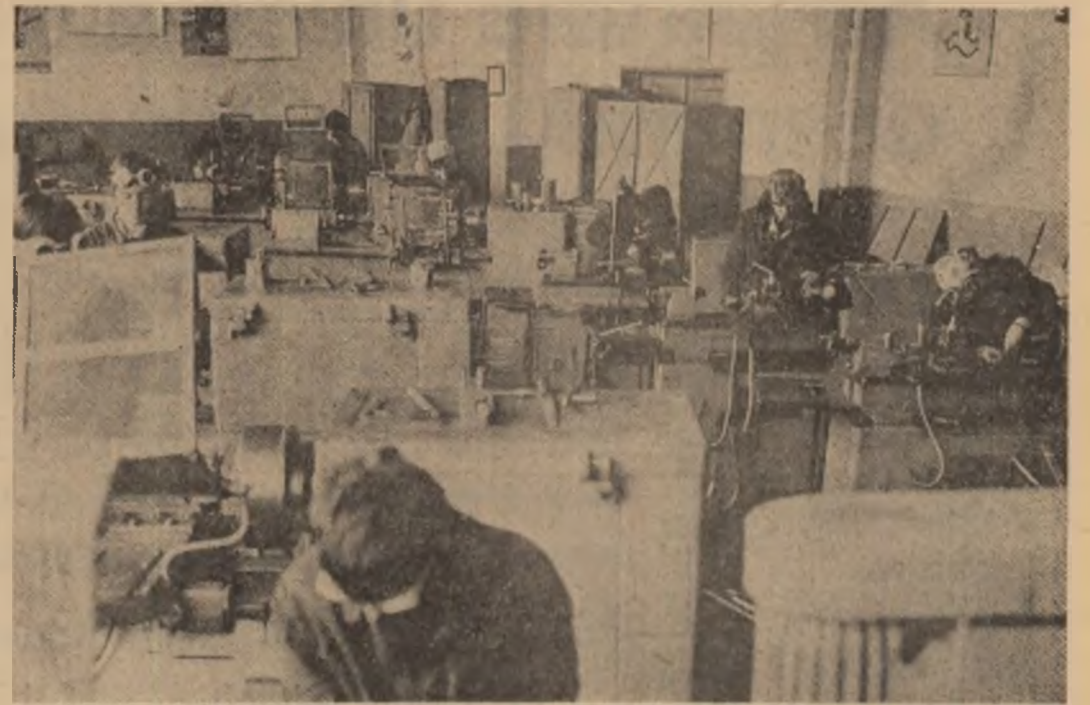
Atelierul de strîngătorie al Liceului industrial Reșița.