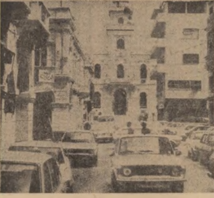
LIBIA: Imagine din Tripoli, capitala țării