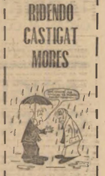
Desen de FLORIN ȘTEFANESCU