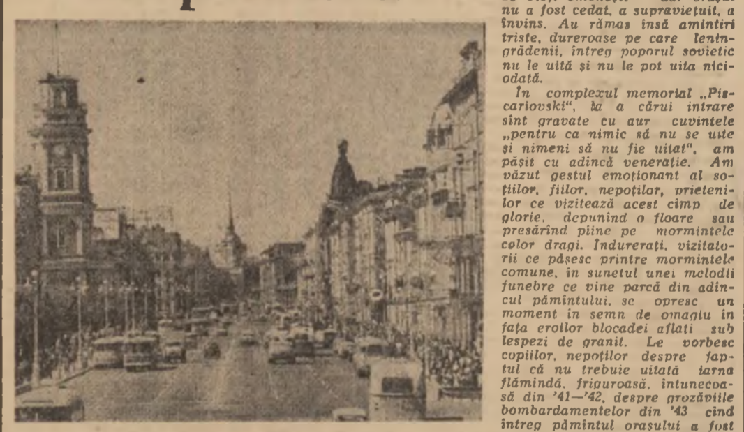
Insemnări din U.R.S.S.

s-au ridicat și cerul a devenit albastru pentru zbor.