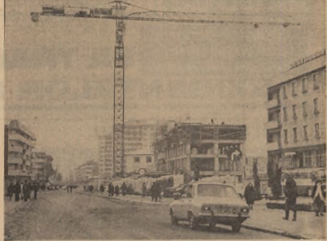
O prezență marcantă în viața orașului Cîmpina — activitatea constructorilor

ÎN PREGĂTIREA CAMPANIEI DE PRIMĂVARĂ Întregul parc de mașini și tractoare care vor lucra în campania din primăvară este pus în stare de funcționare, în județul Satu Mare. Toată, au fost alecătuite de pe acum formațiile de lucru, prevăzîndu-se pentru economisirea de combustibili și lubrifianti, parcararea și alimentarea tractoarelor în cîmp. La această oră, mecanizatorii sînt angajați în reușita campaniei de primăvară. Astfel, el au transportat în cîmp, pe ogoarele unităților agricole de producție pe care le deservește, peste 160 000 tone de îngrășăminte organice, fertilizîndu-se deja 4 500 hectare. În același timp pe 25 000 hectare, îndeosebi cu semănături de toamnă, s-au aplicat aproape 12 000 tone îngrășăminte chimice substanțiale activă.