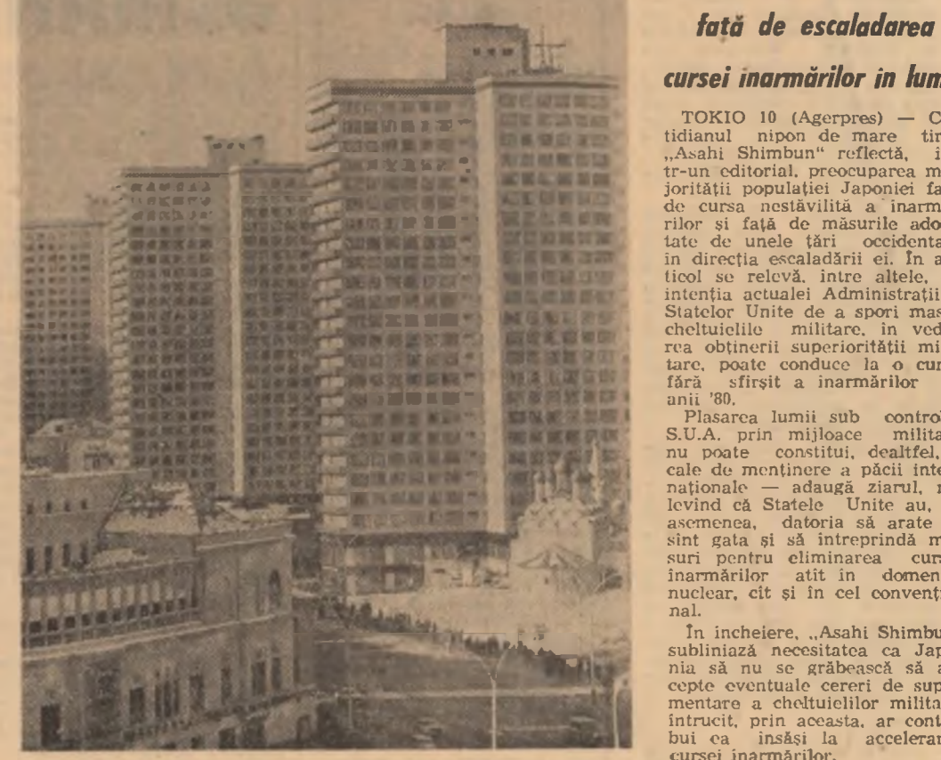
JAPONIA — Preocupare față de escaladarea cursei înarmărilor în lume

NAȚIUNILE UNITE 10 (Agerpres). — Luând cuvântul la deschiderea lucrărilor sesiunii a X-a a celei de-a treia Conferințe a O.N.U. asupra dreptului mării, secretarul general al O.N.U. Kurt Waldheim, a subliniat marea importanță pe care o au elaborarea și adoptarea unor reglementări echitabile, general acceptabile, în acest domeniu, care să corespundă intereselor legitime ale tuturor națiunilor. Vorbitorul a subliniat, în context, strinsa interdependență a problemelor privind Oceanul planetar, evidențind imperativul identificării unor soluții pe baza egalității suverane a statelor. Secretarul general al O.N.U. a subliniat că protejarea și exploatarea resurselor marine, apărarea mediului ambiant marin trebuie să se desfășoare cu luarea în considerare a drepturilor și intereselor fiecărui stat și a arătat că aceste obiective pot fi