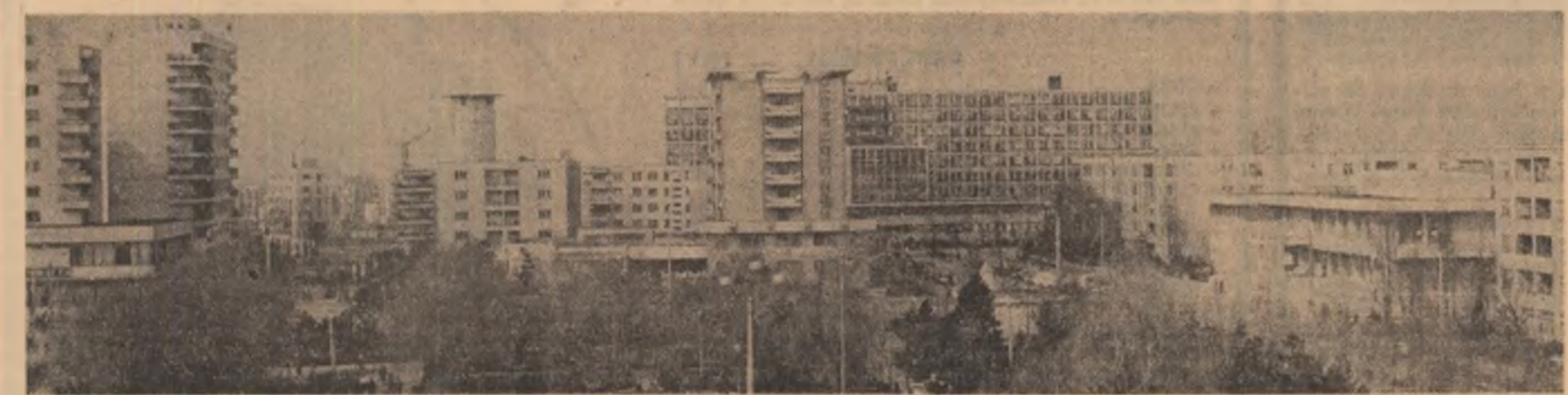
Noul centru al Sloboziei