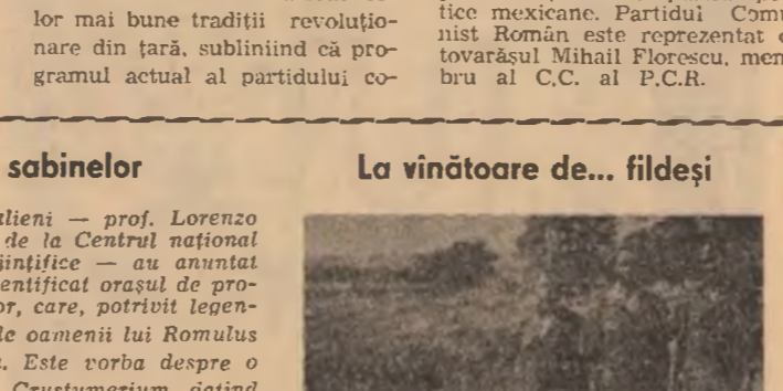
Din ce în ce mai vinșiți pentru pretiosii lor fildeși, elefanții se află, la ora actuală, într-o continuă descreștere numerică. Specialiștii au tras deja semnalul de alarmă, iar numeroase țări au adoptat măsuri drastice pentru protejarea pachidermului. Se pare însă că în multe locuri, braconajul continuă.