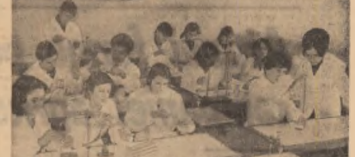
În Laboratorul de chimie al Liceului industrial „Steaua roșu”-Brașov

Înaltele virtuți patriotice și revoluționare ale Partidului Comunist Român, probate cu abnegație și eroism în anii grei și luptei în ilegalitate, în zilele de foc ale revoluției de eliberare națională și socială antifascistă și antiimperialistă deschisă prin insurtecția din august 1944, reprezintă temeiul trainic și a totului politic conducător dobîndit de partid și societatea românească. Sînteză revoluționară a întregii noastre istorii, partidul comunist constituie astăzi centrul vital și natural românesc, conducătorul încercat și clarvăzător al poporului în mărăta operă de furtuire a societății socialiste multilaterale dezvoltate și de înaintare a României spre comunism.