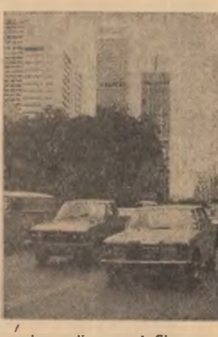
Imagine din orașul Singapore, capitala Republicii Singapore

NATIUNILE UNITE 13 (Agerpres). — Secretarul general al O.N.U., Kurt Waldheim, a adresat un apel Iranului și Irakului, cerându-le să rezolve pe cale pașnică conflictul armat dintre cele două țări și să transmită angajamentul de a începe negocierile profunde și serioase în legătură cu continuarea conflictului armat și înregistrarea de noi pierderi umane. Secretarul general al O.N.U., cere celor două părți să accepte medierea lui sau a reprezentantului său special, Olof Palme, pentru a se ajunge la o soluție politică.