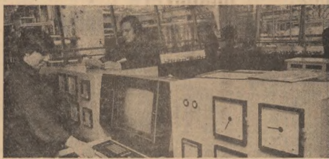
R.D. GERMANĂ: Un sistem de automatizare bazat pe tehnica microprocesoarelor a fost introdus în 1980 la Combinatul petrochimic din orașul Schwedt