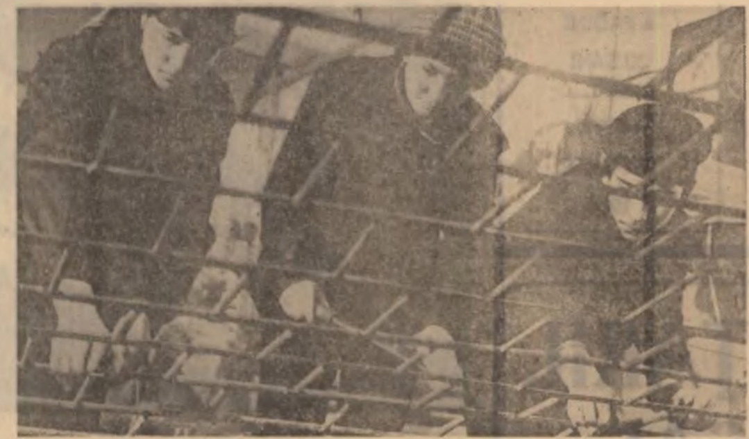
La 17 ani, plămădind vise în ritmul trepidant al faptelor de fiecare zi. Construng construingă-ne tineretea

Martie, aromă proaspătă de veric și pămint aburit. Sonn de bucurie și renastere fete frumoase și soare-n caldar, liniste de zapada si nsa și freamă de sâmbă bătând spice în boarea galbenă, fără hotar. Lumină de dimineată mai grabită, pasi grabiti, mașini grabite și sururii trecătoare spre lonetele cu toporasi. Orasul respira mai curat. Tineretea se bucură de soare și frumos. Si de energii renastere. La sate, mil de uterile desăsear un număr însemnat de acțiuni consensuale întâmplurii, indicatilor date de tovarășii Nicolae Ceaușescu la Congresul întregii țării. În unitățile economice și organizațiile acțiunilor în spiritul productivității, se au ca obiectiv îndeplinirea și depășirea sarcinilor de plan pe acest trimestru, folosirea ca maximum de eficiență a capacităților de producție, economisirea de materii prime, materiale și combustibil. În toată țara sunt inițiate numeroase manifestări politico-educative și culturale-artistice dedicate aniversării a 60 de ani de la crearea Partidului Comunist Român. Am reținut câteva din aceste acțiuni în rândurile ce urmează.