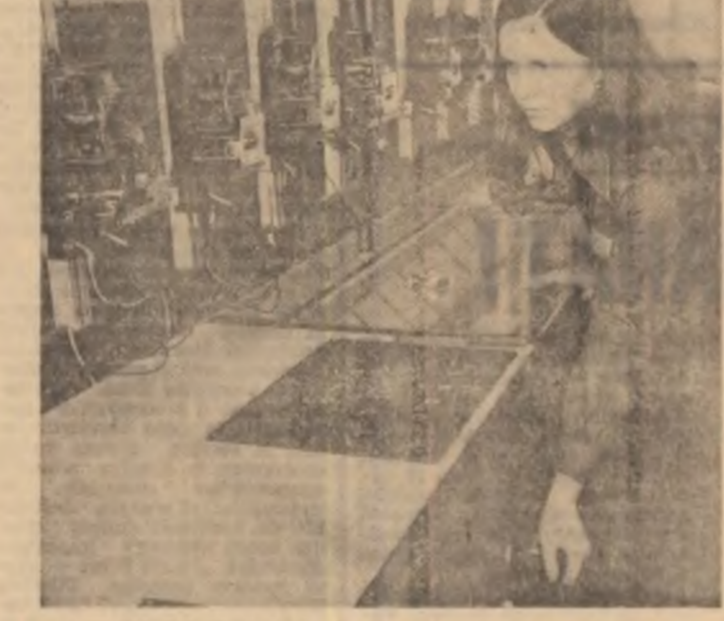
Imagine din Hărăgan! În Slobozia deceniul 9 tineretea, grația și inteligența se întinse sub semnul modern al automatizării.