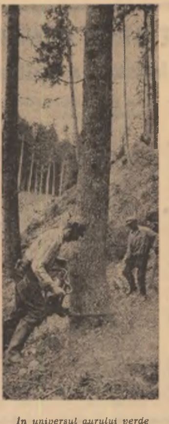
În universul aurului verde

MARIANA BRĂESCU (Continuare în pag. a II-a)