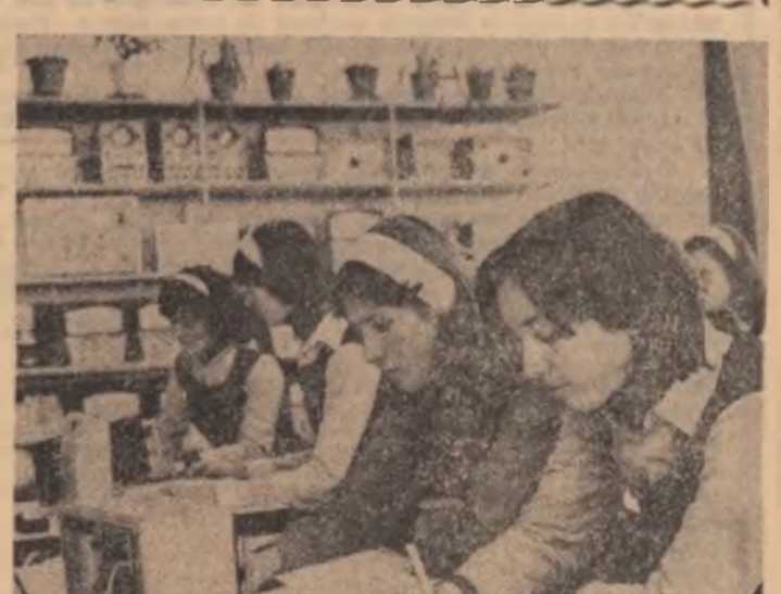
(Continuare în pag. a II-a)