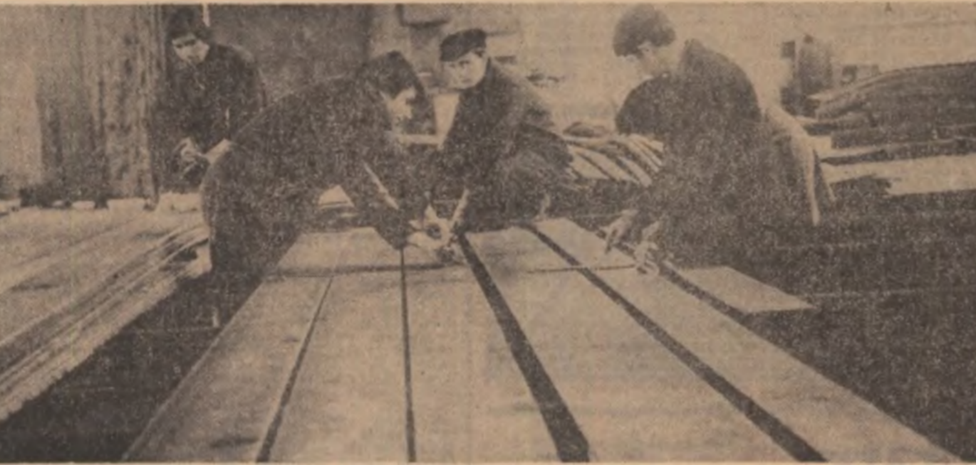
Pin generalizarea debitării centralizate, prin folosirea cu chibzuire a metalului, tinerii de la I.C.M. Boșca economisesc sute de tone materie primă

Întreprinderea „Cablul românesc” din Ploiești livrează de mai mult timp pe piața externă o largă gamă de cabluri de tracțiune și, mai de curînd, cabluri destinate industriei energetice, de la un an la altul producția pentru export crescînd considerabil. Dacă, în ceea ce privește calitatea cablurilor executate, nici întreprinderea de comerț exterior cu care unitatea colaborează — respectiv Metalim-Portexport și Electroimportexport —, nici beneficiarii externi nu au nimic de obiectat, probleme mari ridică, de mai multă vreme, omorarea ritmică și la timp a termenilor planificate de livrare. Anul trecut, spre exemplu, planul la export a fost realizat doar în proporție de 56,7 la sută. Bineînțeles, aceasta ar fi trebuit să constituie un serios semnal de alarmă atât pentru