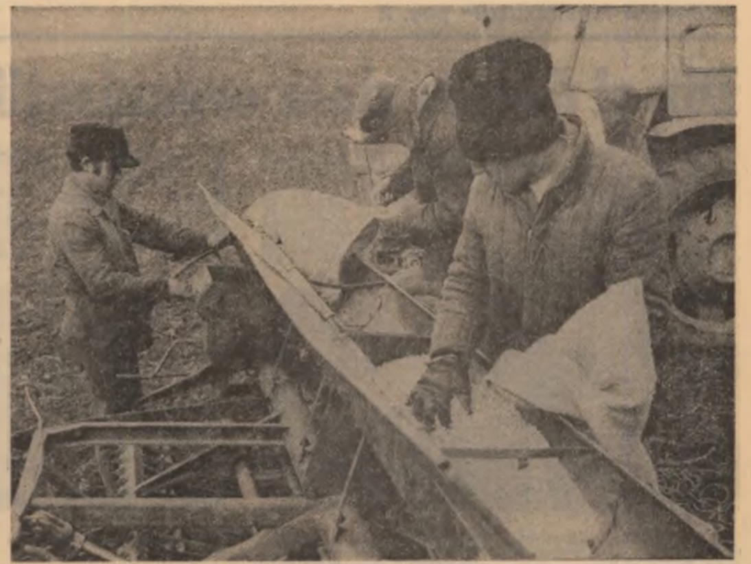
Pe ogoarele ialomițene