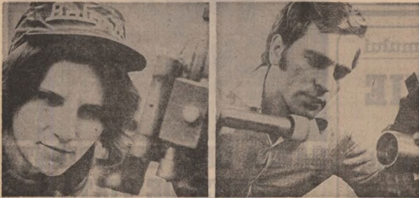
Fotografie de GHEORGHE CUCU