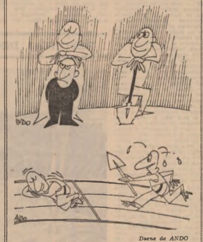
Desen de ANDO