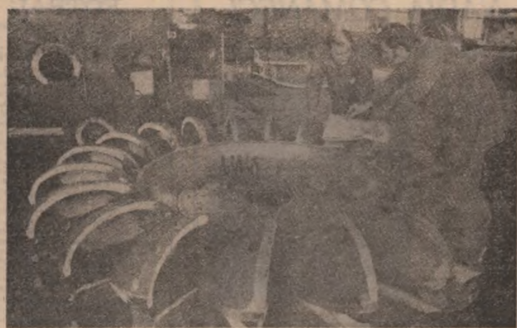
R.P. BULGARIA — Aspect din secția de turbine a uzinelor „Vavtorov” din Plevna, unde se produc compresoare mari, turbine hidrolice, pompe pentru sistemele de irigații