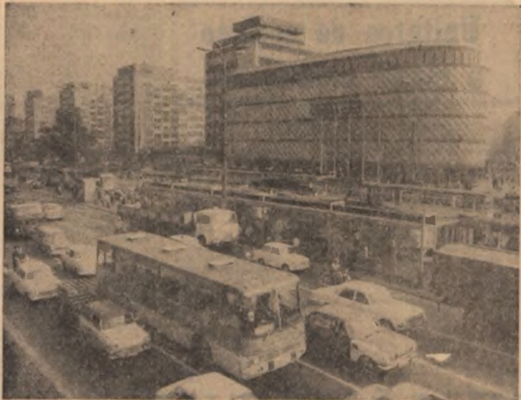
R. D. GERMANĂ : „Hainele noi” conferă „bătrânilui” Leipzig prospețimea tinereții