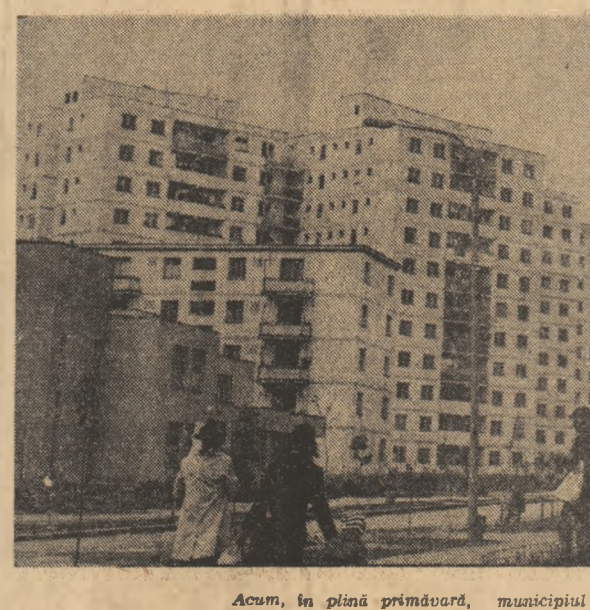
Acum, în plină primăvară, municipiul Rm. Vilcea își etalează maiestuos tinerețea