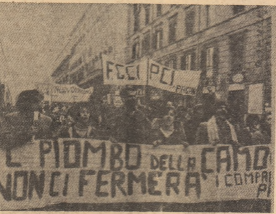
ITALIA — La Roma s-a desfășurat o demonstrație a tinerilor și studenților din sudul țării, în semn de protest față de lipsa unor programe guvernamentale de dezvoltare economică a acestei regiuni