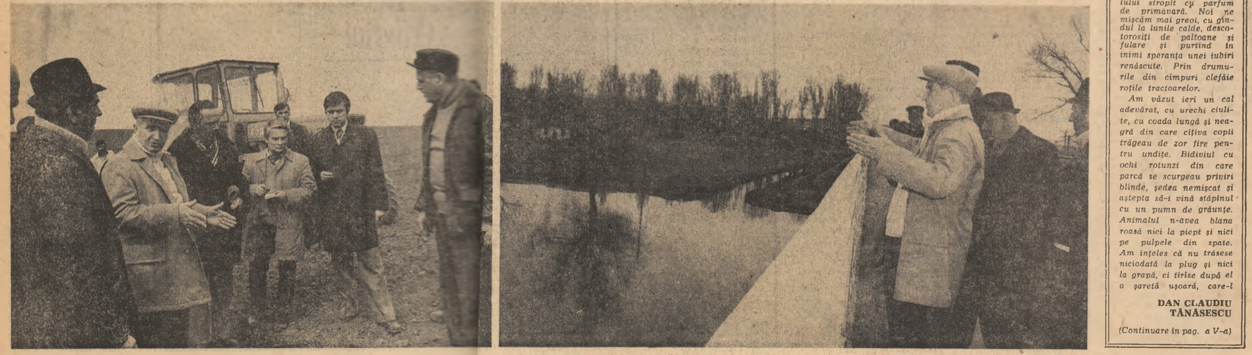
Tovarășul Nicolae Ceaușescu în timpul vizitei sale în unități agricole din județele Giurgiu, Călărași și Ialomița.