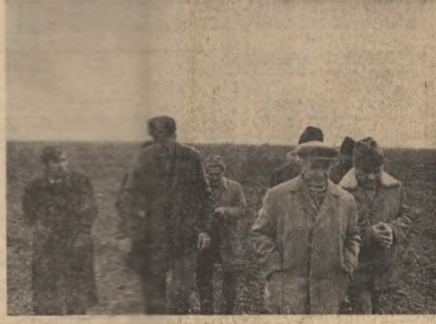
Tovarășul Nicolae Ceaușescu în timpul vizitei sale în unități agricole din județele Giurgiu, Călărași și Ialomița.