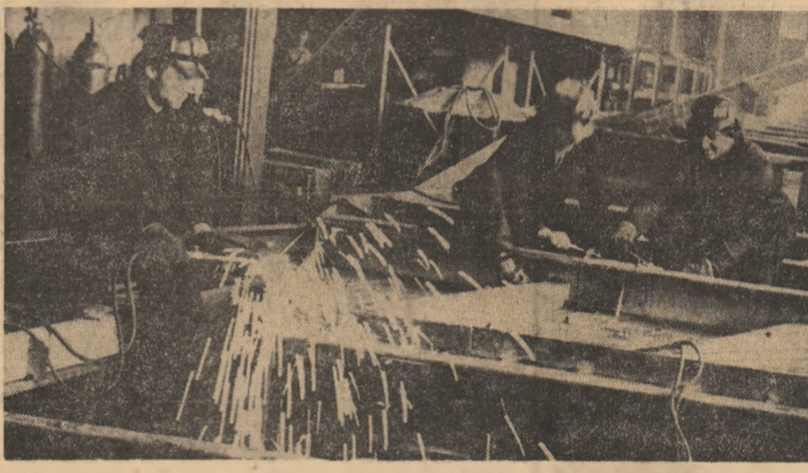
La I.C.M. Bocșa, zi obișnuită de lucru