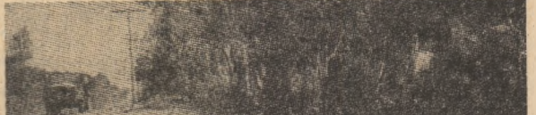
Trupe rămase fidele Juntei de guvernământ din Salvador, în timpul unei operațiuni de reprimare

AMMAN 7 (Agerpres). — La Amman s-au încheiat, marți,