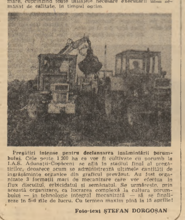
Preșterii intense pentru declanșarea însămînțării porumbului...