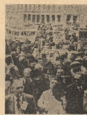
ITALIA — aspect din timpul unei demonstrații desfășurate la Roma în sprijinul unor revendicări sociale

„Cosmos—1262” — În Uniunea Sovietică a fost lansat un nou satelit artificial al pământului „Cosmos-1262”, anunță agenția TASS, care precizează că la bordul satelitelui se află aparatură destinată continuării cercetării spațiului cosmic.