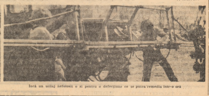
Încă un utilaj nefolositor o zi pentru o defecțiune ce se putea remedia într-o oră