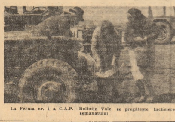
La Ferma nr. 1 a C.A.P. Bolintin Vale se pregătește încheierea semănatului