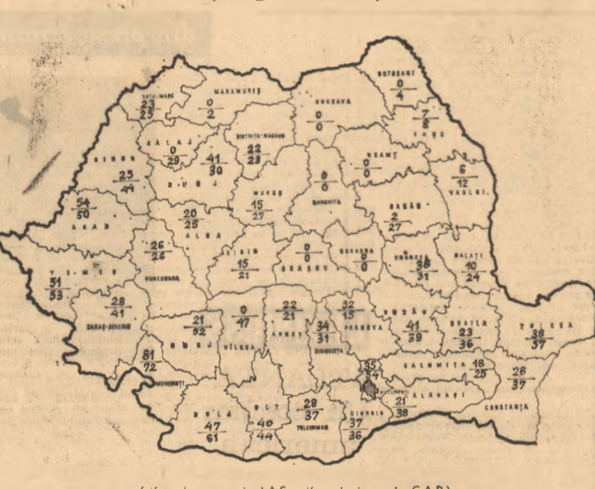
(cifra de sus — în I.A.S., cifra de jos — în C.A.P.)