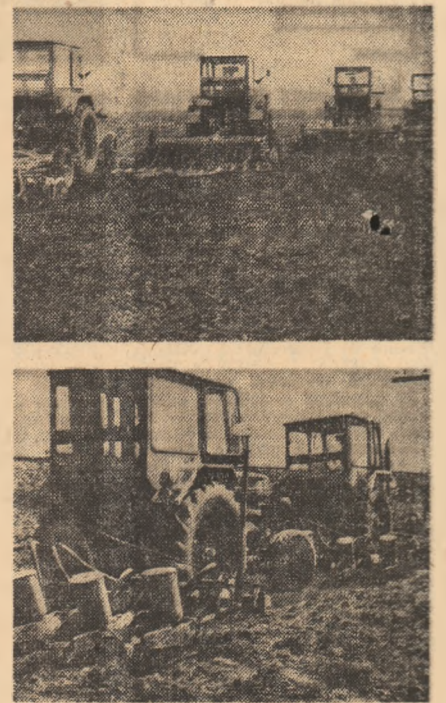
Pregătitul terenului — iată „urgenta urgențelor” la C.A.P. Videle. Mai ales în condițiile în care două semănători au staționat timp de două ore din lipsa frontului de lucru