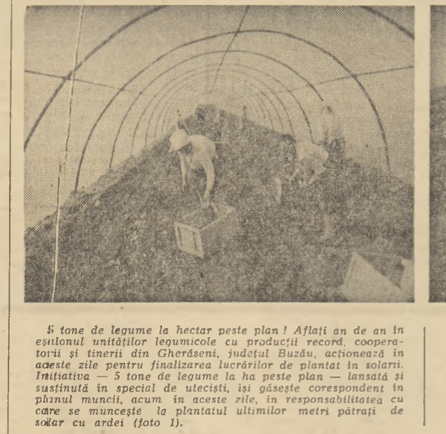
5 tone de legume la hectar peste plan! Aflați an de an în calendarul unităților legumicole cu producții record, cooperativii și tinerii din Gherdești, județul Buzău, acționează în aceste zile pentru finalizarea lucrărilor de plantat în solarii. Inițiativa — 5 tone de legume la ha peste plan — lansată și susținută în special de tinerii, își găsește corespondent în plîzul muncii, acum în aceste zile, în responsabilitatea cu care se muncesc la plantatul ultimilor metri pătrați de solău cu ardei (foto 1).