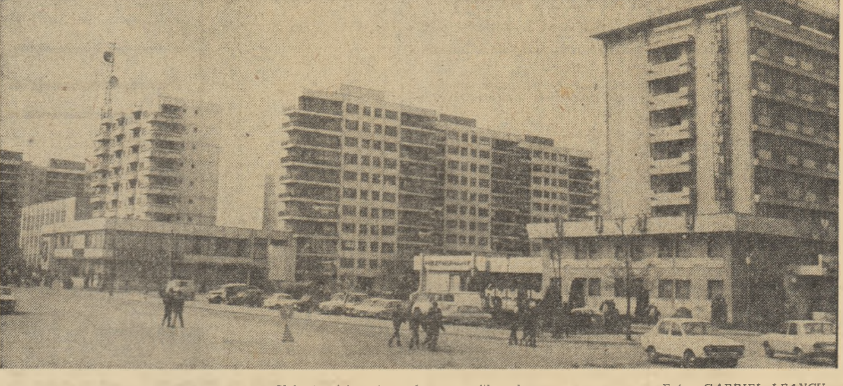
Slobozia își conturează un profil modern

Cel mai mare Combinatului de producție a lemnului din Drobeta Turnu-Severin a produs în plus de la începutul anului 254 me chereștea, 539 mp furnire estetice, 91 000 mp placaj și 103 tone plăci fibrolemnose, alte sortimente care au permis să se realizeze suplimentar mobilă în valoare de peste o jumătate de milion lei. Dealtfel, această unitate și-a îndeplinit integral sarcinile de plan venite de la începutul anului la principalii indicatori economici și a depășit producția marcată cu peste 2 milioane de lei.