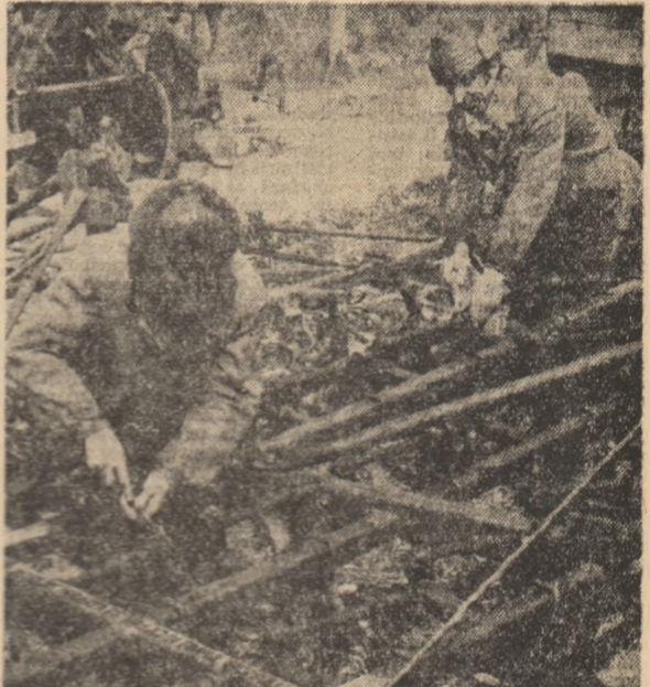
Combinările, supuse unor operații de „reparație”, sînt gata pentru a intra în brazdă. Sperăm ca azi, să-i asculte „la flu” pe mecanizatori.