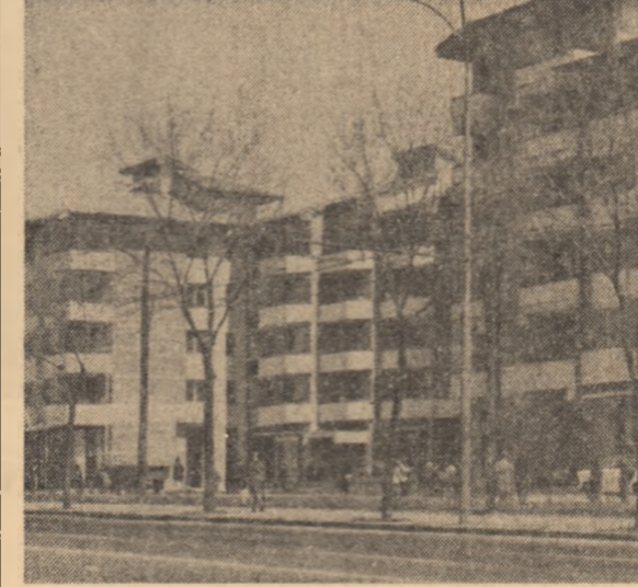
Noi construcții în zona Băneasa din Capitală