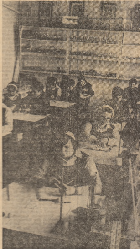
În laboratoare moderne știința elerii deprind tainele chimiei