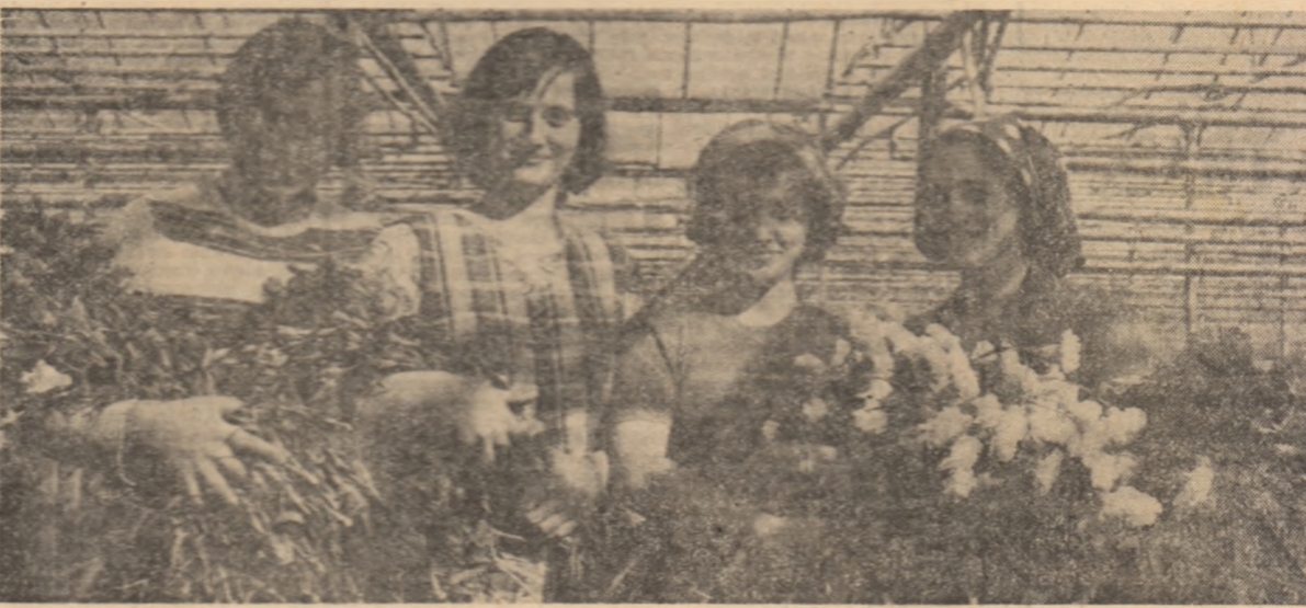
Un zîmbet al tinereții, un zîmbet al însoțirii în istorie