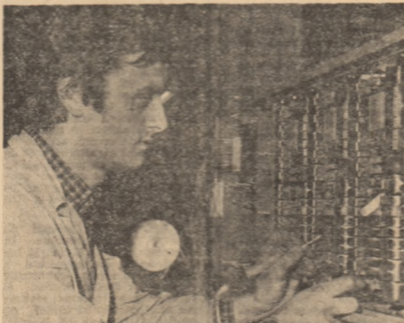
Cercetarea științifică în ramurile de vîrf presupune competență, perseverență, efort creator

Și cum ar putea fi numit, în puține cuvinte, acest minunat tineret de azi, aflat în primele rînduri ale istoriei în grandioasa bătălie pentru cucerirea unor noi culmi de civilizație și progres, tineretul de azi, ale cărui orizonturi de afirmare sînt nelimitate, tineretul șantiereilor, al ogoarelor, al școlii, tineretul care muncește, învață, creează cu o remarcabilă sete de mai bine și mai frumos, tineretul de azi, beneficiar și creator a ceea ce generațiile trecute nici nu îndrăzneau să viseze? Cuvintele se desprind de la sine de pe buzele a zeci și sute de mii de tineri. Sînt cuvinte care au pătruns adînc în conștiințele lor, cuvinte-simbol, cuvinte-îndemn, cuvinte-angajament, pentru că definirea tineretului de azi printr-o sintagmă de o neîmormitură generozitate și încredere aparține chiar părintelui său iubit și prietenului cel mai apropiat, secretarul general al partidului, tovarășul Nicolae Ceaușescu: tineretul este viitorul însuși al națiunii noastre comuniste. Definiție care exprimă genial noul destin al tinerilor din România de azi, destinul unei generații care are în fața sa viitorul.