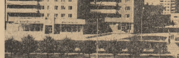
R.P. MONGOLĂ: Imagine din unul din noile și modernele cartiere ale capitalei țării, Ulan Bator, aflată în plină înnoire urbanistică

CIUDAD DE MEXICO 3 (Agerpres). In capitala Mexicului a avut loc o reuniune regională în problema dezarmării, la care au participat reprezentanți ai unor organizații obștești, activiști sindicali, juriști, scriitori, profesori universitari și ziaristi din 15 țări, situate în America Latină și bazinul Mării Caraibiilor. In cadrul dezbaterilor, s-a subliniat necesitatea amplificării acțiunilor pentru a se explica opiniei publice naționale și internaționale problemele pe care le reprezintă pentru omenire creșterea nestăvilnică a producției și stocurilor de arme nucleare.