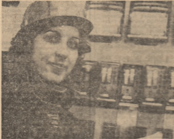
O meserie în care fetele sînt deosebit de apreciate: operator