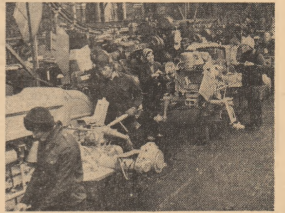
Pe banda de montaj a întreprinderii „Tractorul” din Brașov

nat de piese de schimb, care de la începutul anului și până acum însumează o producție fizică de peste 5 milioane lei.