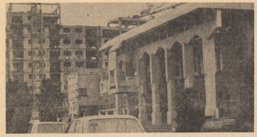
Noua arhitectură a Romanului

Colectivul Întreprinderii mecanice din Botoșani și-a onorat angajamentul asumat în întrecerea socială pe întreg anul 1981 la toți indicatorii economico-financiar. Producția netă a înregistrat un spor de 1,6 milioane lei, producția marfă a fost depășită cu 3 milioane lei, productivitatea muncii - cu 8,2 la sută, iar cheltuielile materiale au scăzut față de cea planificată cu 16,4 lei la fiecare 1 000 lei producție marfă. În același timp, colectivul întreprinderii de utilaje și piese de schimb din aceeași localitate a livrat suplimentar de la începutul anului și până în prezent 1 000 de pompe centrifugale de tipuri „Lotru-Cernă-Criș”, spor de producție realizat în totalitate pe seama creșterii productivității muncii și în condițiile reducerii cheltuielilor materiale cu 7 lei la fiecare 1 000 lei producție marfă față de nivelul planificat.