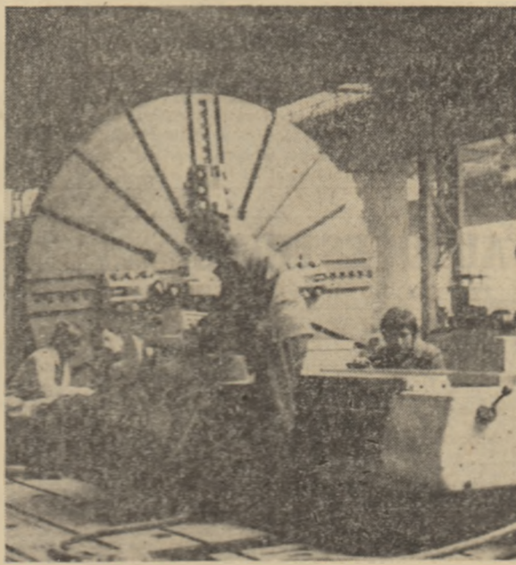
Tineri muncitori au mare agorag la întreprinderea mecanică din Aiud - județul Alba