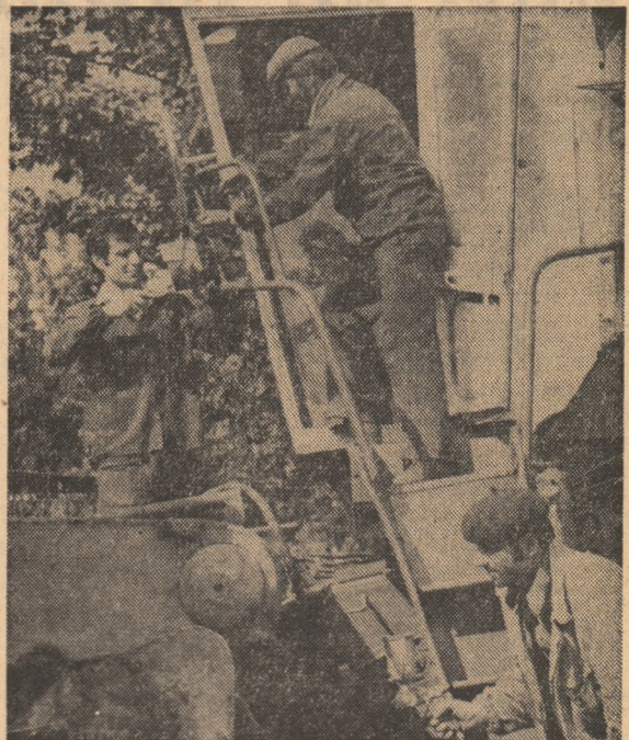
Reparații de sezon înainte de campania de recoltare

BUZĂU: „Bun de intrat în lan“ — un certificat tehnic acordat de urgență tuturor utilajelor!