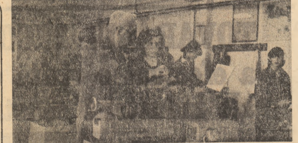
Elevii clasei a XII-a de la Liceul de fizică-matematică nr. 6 din Capitală...