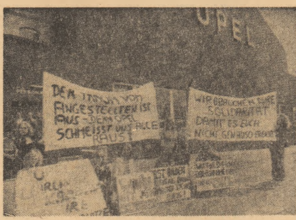
R. F. GERMANIA — Demonstrația a muncitorilor de la uzinele „Opel” împotriva reducerii locurilor de muncă