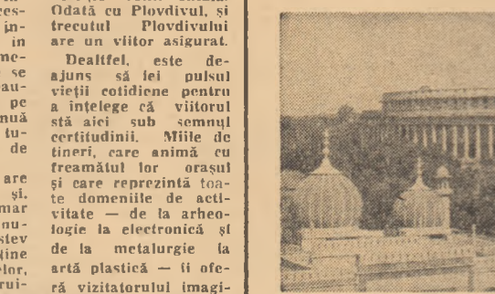
INDIA — Imagine din New Delhi

DELHI 4 (Agerpres). — Luind cuvântul la o reuniune a ministrilor învățământului din statele indiene, primul ministru al Indiei, Indira Gandhi, a arătat că, în anii care au trecut de la dobândirea independenței de stat, în India a crescut numărul elevilor în școli cu peste 70 la sută. În prezent, masa principală din cei 100 de milioane de elevi este formată din copiii muncitorilor săraci și țărilor și muncitorilor — copiii ale acelor pături care înainte de independență nu aveau acces la învățământ. În anul 1950 în India erau numai 30 de universități și aproximativ 1.000 de colegii. În prezent numărul colegiilor fiind de aproape 5.000, iar al universităților de 124. Numărul studenților este de peste 2,5 milioane.