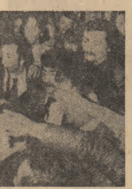
FRANȚA, Partidul socialist și Partidul comunist...