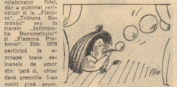
Rubrică realizată de VASILE RĂVESCU