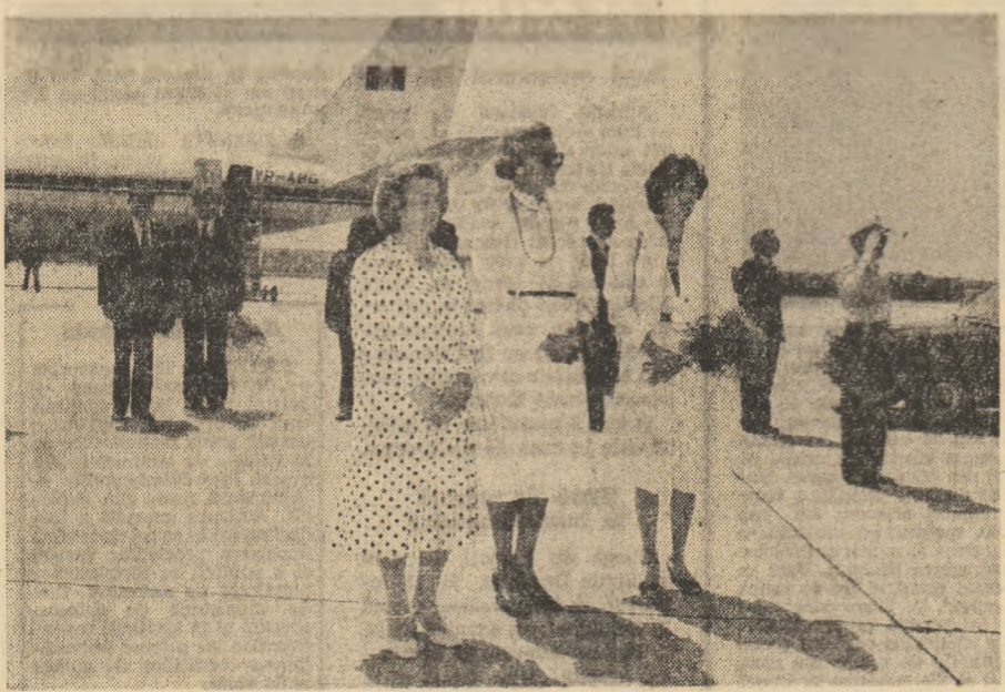
(Urmare din pag. 1)

na Herma Kirchschlager, de la cancelarul federal Bruno Kreisky. În momentul despărțirii, președintele Nicolae Ceaușescu multumeste încă o dată, în numele său și al tovarășei Elena Ceaușescu, președintelui Rudolf Kirchschlager pentru rezultatele fructuoase ale convorbirilor avute. La rîndul său, președintele Rudolf Kirchschlager multumeste și el tovarășii Nicolae Ceaușescu și Elena Ceaușescu, președintelui Rudolf Kirchschlager pentru primirea călduroasă de care s-a bucurat în timpul șederii pe pămîntul austriac, își exprimă, și cu acest prilej, satisfacția pentru rezultatele fructuoase ale convorbirilor avute. La rîndul său, președintele Rudolf Kirchschlager multumeste și el tovarășii Nicolae Ceaușescu și Elena Ceaușescu, președintelui Rudolf Kirchschlager pentru primirea călduroasă de care s-a bucurat în timpul șederii pe pămîntul austriac, își exprimă, și cu acest prilej, satisfacția pentru rezultatele fructuoase ale convorbirilor avute.