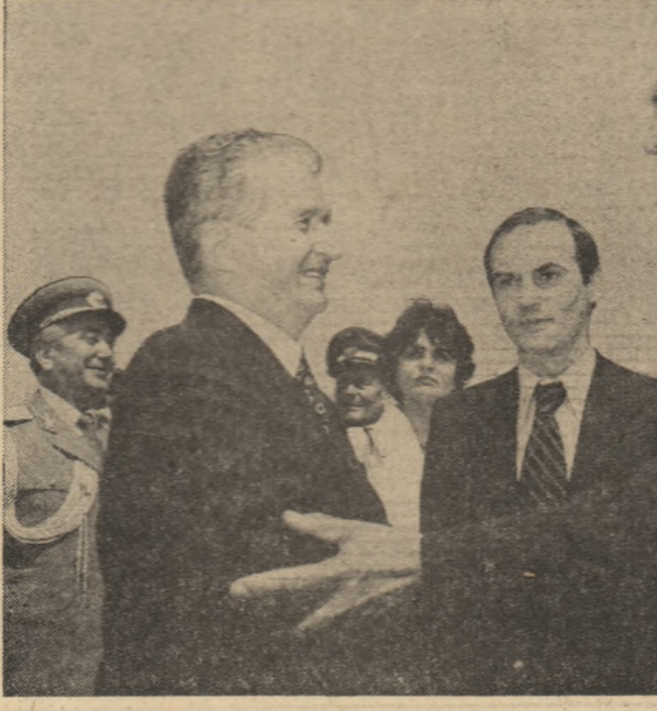
Comandantul companiei de onoare vine în întâmpinarea tovarășului Nicolae Ceaușescu și prezintă raportul. Fanfara militară întonează Imnul de Stat al Republicii Socialiste România și Imnul austriac. Se întonează „Onorul la general”. Președintele federal al Austriei roagă pe președintele Republicii Socialiste România ca, împreună, să treacă în revistă compania de onoare.

Vineri, 12 iunie, s-a încheiat vizita de stat efectuată în Austria de președintele Republicii Socialiste România, tovarășul Nicolae Ceaușescu, împreună cu tovarășa Elena Ceaușescu, la invitația președintelui federal Rudolf Kirchschläger și a doamnei Herma Kirchschläger. Desfășurată sub semnul stimei depline, al respectului reciproc, noua întâlnire la nivel înalt româno-austriac, așa cum rezultă și din comunicatul comun semnat în cursul dimineții de cei doi șefi de stat, a deschis largi perspective conlucrării bilaterale pe o bază trainică, în folosul comun, al edificării unei lumi mai bune și mai drepte. Președinții Nicolae Ceaușescu și Rudolf Kirchschläger, tovarășa Elena Ceaușescu și doamna Herma Kirchschläger, precum și cancelarul federal Bruno Kreisky au sosit împreună la aeroportul internațional, care este împodobit cu drapelul celor două state. ...Începe ceremonia oficială a plecării. O gardă militară, în ținută de paradă, prezintă onorul.