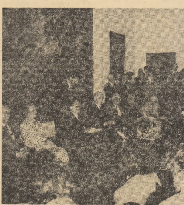
ențela pe care le-ar putea exercita asupra acestor relații creșterea cursului dolarului pe piața mondială, tovarășul Nicolae Ceaușescu a dat următorul răspuns:

Tot privitor la situația din Polonia, un reprezentant al ziarului „Frankfurter Rundschau” — R.F.G. a întrebat dacă România a fost consultată în vreun fel în legătură cu recenta scrisoare trimisă de P.C.U.S. conducerii poloneze.