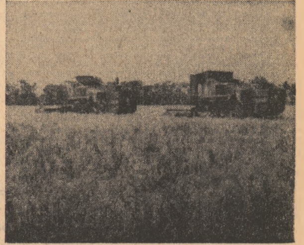
Recoltatul orzului la I.A.S. Slobozia, ferma 3 Amara, județul Ialomița