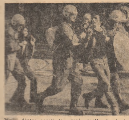
Mulți dintre acești tineri, extenuați de pe urma eforturilor de a găsi un loc de muncă...