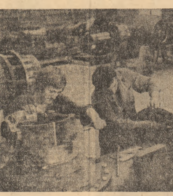
locului, ori de cîte ori au fost solicitați, sprijinul cerut.